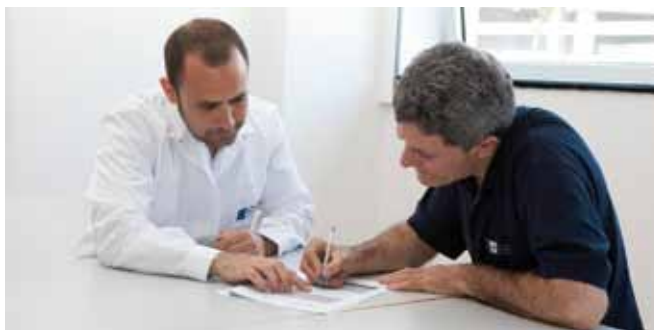
Figura 2. Cumplimentación de cuestionarios durante la fase experimental.