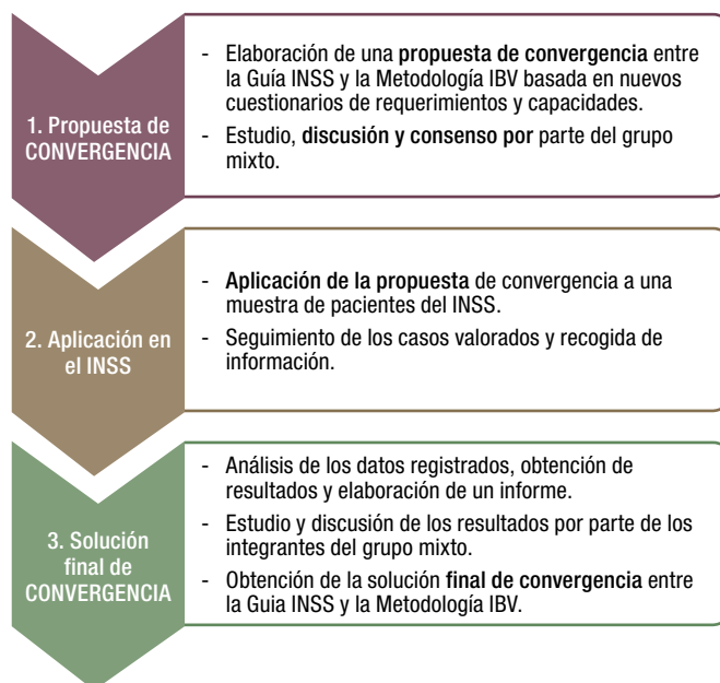
Figura 1. Plan de trabajo del proyecto “Convergencia INSS-IBV”.

La fase experimental se llevó a cabo en la Unidad Médica de la Dirección Provincial de I INSS de Valencia mediante la presencia de un técnico del IBV, encargado de la administración del cuestionario de requerimientos del puesto de trabajo, y de un médico inspector del INSS, encargado del cuestionario de capacidades (Figura 2). Los cuestionarios se aplicaron a un grupo de 33 pacientes procedentes del grupo de revisiones de grado, incapacidad temporal y prórroga de incapacidad