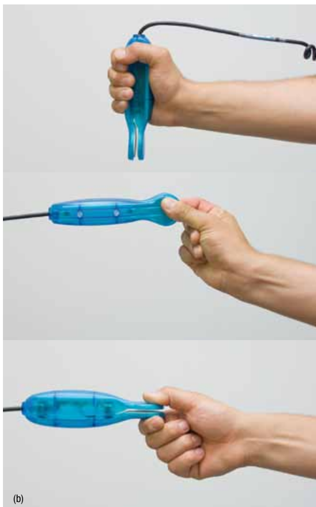
Figura 1. (a) Posicionamiento del protocolo de medición; (b): Gestos valorados.

permite definir de forma adecuada las terapias necesarias para su recuperación, establecer un alta o una baja a un trabajador e incluso realizar una propuesta de incapacidad acorde a la verdadera limitación de la persona.