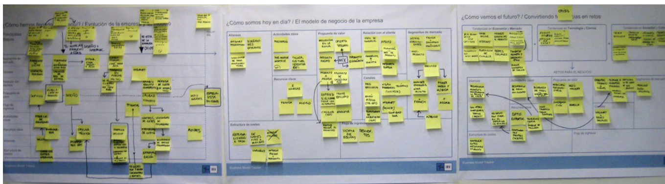
Figura 1. Panel del Business Model Tracker .

de negocios ( Business Model Canvas ) adaptadas por el IBV para incluir la evolución histórica de la empresa ( Business Model Tracker ). De este modo, el proyecto ha incorporado trabajos tales como la revisión de FGROUP como empresa en la actualidad, la identificación de los principales actores que distribuyen mobiliario en el mercado sociosanitario, así como los principales factores que van a tener una influencia relevante en ese mercado en los próximos años, la definición del modelo de negocio o la definición y desarrollo de un producto coherente con el modelo de negocio definido.