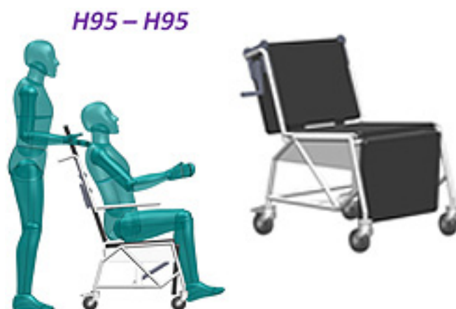
Figura 4. Prototipo funcional MODULA.

elegida como núcleo del modelo de negocio y el desarrollo y validación de uno de los conceptos generados.