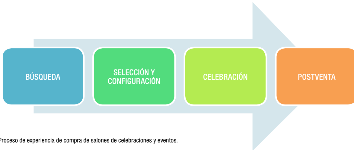
Figura 1. Proceso de experiencia de compra de salones de celebraciones y eventos.