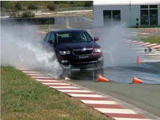
Figura 2. Pruebas en asfalto.

La pista de conducción todoterreno está diseñada en un entorno totalmente natural y dentro de las instalaciones del Circuito Ricardo Tormo, extendiéndose a lo largo de más de 100.000 m 2 . A lo largo de los 5 km de rutas se pueden encontrar diferentes tipos de dificultad, por lo que es apta para trabajar con todo tipo de vehículos (desde todoterrenos hasta camiones pesados). La orografía del terreno (monte bajo con vegetación autóctona) permite que la mayor parte de los obstáculos como dubies, zonas rocosas, vadeos, pendientes, laterales y rampas de hasta el 70%, sean totalmente naturales (Figura 3 y 4).