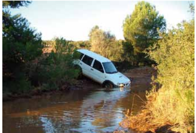
Figura 4. Pruebas en el circuito de todoterreno.

En ambos circuitos, se puede obtener información en tiempo real de los parámetros relacionados con el rendimiento de la conducción, como tiempo, velocidad, distancia, aceleración y orientación del vehículo. El sistema implantado en el circuito permite superponer la trayectoria del vehículo sobre el trazado y calcular las desviaciones en cada uno de los giros que se han completado (Figura 5).