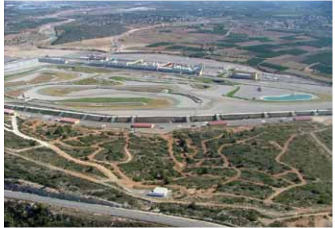
Figura 3. Pistas de conducción de todoterreno.

La pista de conducción todoterreno está diseñada en un entorno totalmente natural y dentro de las instalaciones del Circuito Ricardo Tormo, extendiéndose a lo largo de más de 100.000 m 2 . A lo largo de los 5 km de rutas se pueden encontrar diferentes tipos de dificultad, por lo que es apta para trabajar con todo tipo de vehículos (desde todoterrenos hasta camiones pesados). La orografía del terreno (monte bajo con vegetación autóctona) permite que la mayor parte de los obstáculos como dubies, zonas rocosas, vadeos, pendientes, laterales y rampas de hasta el 70%, sean totalmente naturales (Figura 3 y 4).