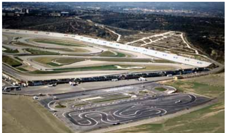
Figura 1. Pistas de conducción de circuito de asfalto.

La Escuela de Conducción Luis Climent ubicada en el Circuito de la Comunidad Valenciana Ricardo Tormo (Cheste) cuenta entre sus insta-