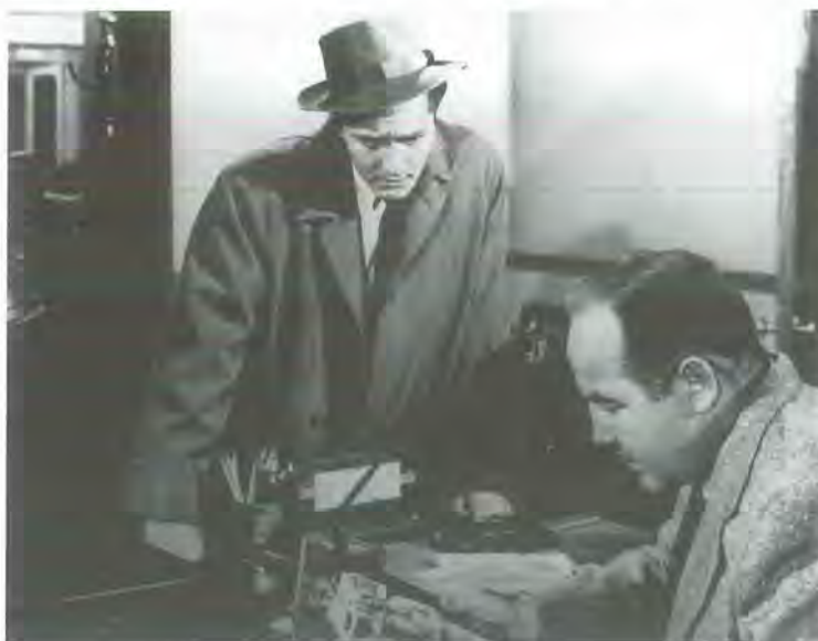
Trágica información (Scandal Sheet, 1952), de Phil Karlson

Let's Get Harry (EEUU, Stuart Rosenberg, 1986) (co-arg.)