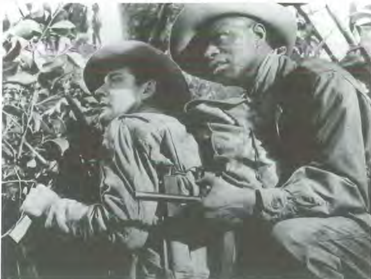
China Gate ("La puerta de China", 1957)