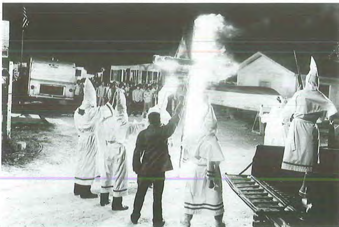
Alamo Bay (La bahía del odio)

Se trata, por lo tanto, de personajes que aparecen por lo general situados fuera de su lugar y de su espacio natural y que viven los momentos de desconcierto previos a la salida de una mutación histórica de mayor o menor calado. En algunas ocasiones, para agravar todavía más la situación anterior, se trata también de personajes que viven la crisis previa del paso a la adolescencia ( El soplo al corazón , Lacombe Lucien , La pequeña , Adiós, muchachos ), aunque este tránsito pueda tener lugar en los momentos postreros de sus vidas ( Milou en mayo , Atlantic City U.S.A. ) o aunque éste finalmente se rechace y se opte por la vía alternativa del suicidio ( Fuego fatuo ). Es decir, individuos que habitan