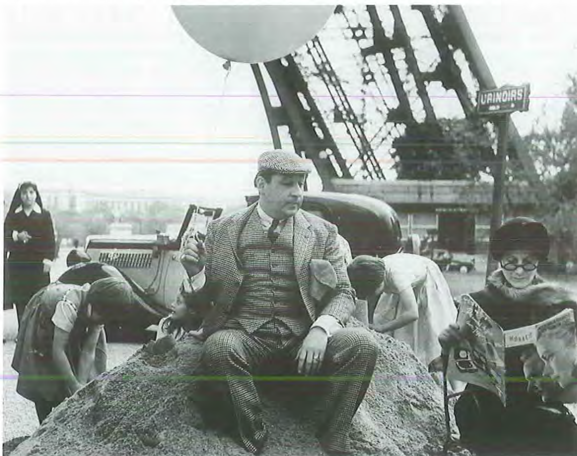
Zazie en el metro

Se trata de seres que han escogido frecuentemente el camino equivocado, pero que asumen éste con todas sus consecuencias frente a otro sector de la sociedad, bastante más numeroso, que o bien se oculta tras las cartas enviadas por correo - Lacombe Lucien -, o bien tras los hábitos monjiles - Adiós, muchachos -, o bien tras las vestimentas blancas del Ku-Klux-Klan - Alamo Bay ( La bahía del odio )- para denunciar a sus semejantes. De ahí, por una parte, el carácter de arquetipo que el cineasta