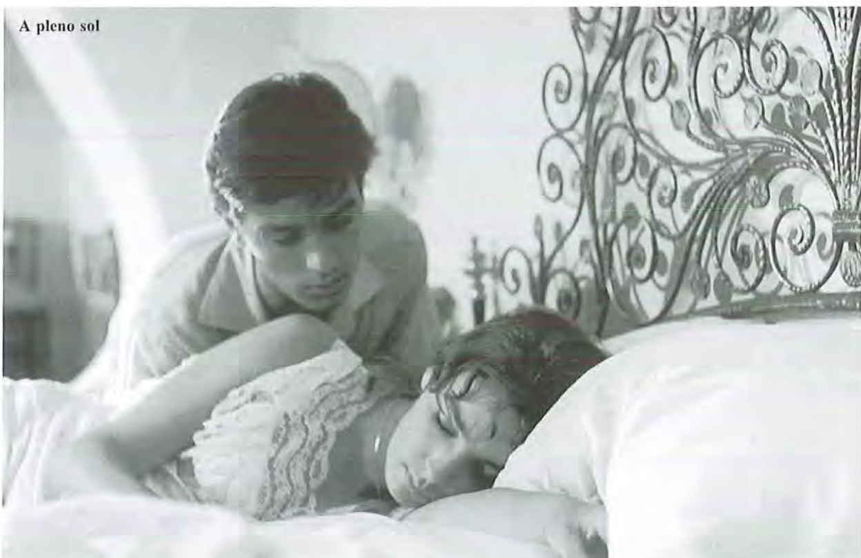
A pleno sol