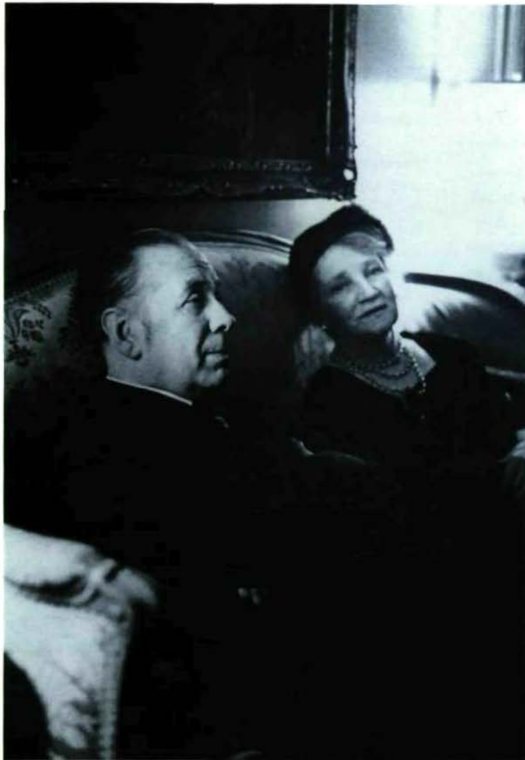
Borges, acompañado de su madre, fotografiado por Jesse Fernández

un imaginario que depende para existir (para ser verosímil o, como hubiese dicho Borges, "real") del lenguaje en el que encarna. ¿Cómo, por ejemplo, figurar en imágenes unos "hrônir", esos objetos, "hijos casuales de la distracción y el olvido", cuya existencia registra el Onceno Tomo de la Enciclopedia de Tlön? ¿O la barroca tendencia a la duplicación de todas las cosas en esa región imaginaria, de la que es clásico ejemplo el "umbral que perduró mientras lo visitaba un mendigo y que se perdió de vista a su muerte"? Los ejemplos abundan y es absurdo citar lo obvio. Quizá podamos comprender ahora por qué para Borges cotejar un film y la novela o cuento de donde procedía era una actividad carente de sentido.