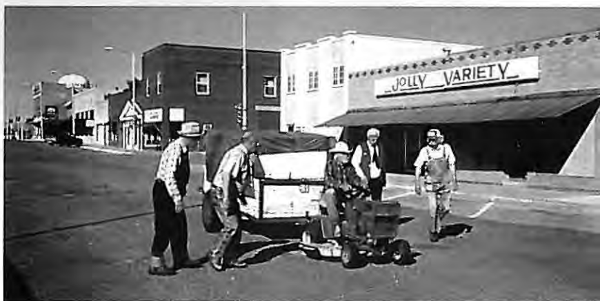
Una historia verdadera