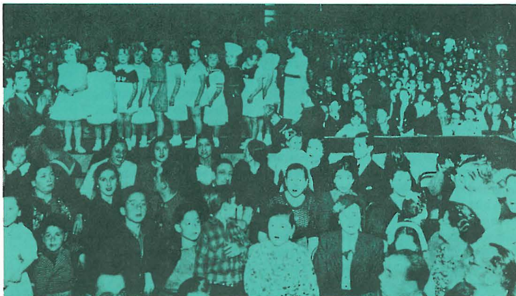
Concurso convocado por la Asociación de la Prensa en el Teatro Rosalía Castro en La Coruña para elegir a la niña gallega que más se pareciera a Sirley Temple. Vida Gallega , 30-4-1936