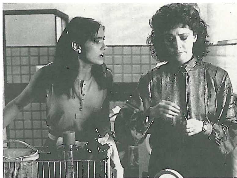
INTIMIDADES EN UN CUARTO DE BAÑO.