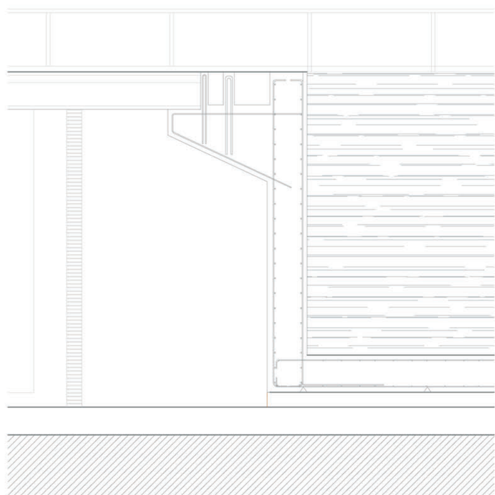
Sección c: tanque de saltos e 1:50