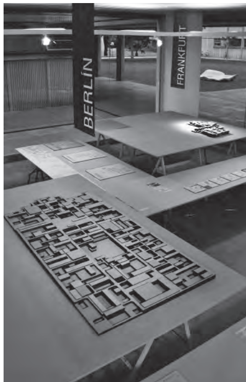
1 VISTA GENERAL DE LA EXPOSICIÓN EN LA SALA DE LA E.T.S.A. VALENCIA.

Mat-building es el término que utiliza Alison Smithson para definir una arquitectura asociativa, flexible, cambiante y sistematizada, un resultado de alta densidad y baja altura, y un contenido consecuente con la movilidad y las relaciones establecidas entre sus habitantes. El concepto nace con anterioridad al artículo publicado en el número de septiembre de 1974 de la revista Architectural Design . De hecho, "How to recognise and read Mat-building. Mainstream architecture as it has developed towards the mat-building" es, además de un texto cargado de ambigüedad, una recopilación cronológica de los edificios realizados hasta el momento que podrían desvelar las características de este fenómeno.