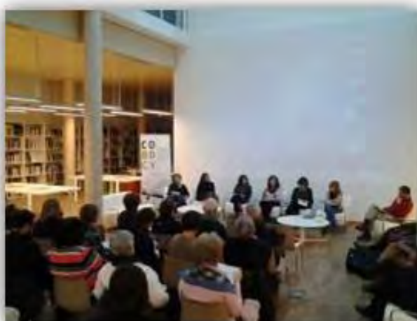
Taula Redona organitzada pel COBDCV. 30 de novembre del 2013. Las Naves

Para comprender el conflicto entre los formatos, soportes y documentos de archivo empezaré por exponer algo menos complejo como es el caso de los archivos fotográficos. Algunas personas han adquirido fotografías, mediante compras o donaciones, generalmente relacionas con un motivo (por ejemplo Valencia) y a ese conjunto de fotografías le han puesto la palabra ‘archivo’, como es el caso del