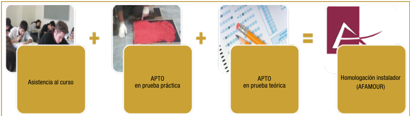
Figura 3. Procedimiento de homologación para instalador de pavimento continuo de caucho.

Además, en la Guía se detallan los resultados y conclusiones de las propiedades más importantes para la utilización de este tipo de pavimentos en áreas de juego, aportando directrices generales de ayuda a fabricantes, instaladores y prescriptores. Por otra parte, como anexo se incluye un modelo de pliegos de prescripciones técnicas.