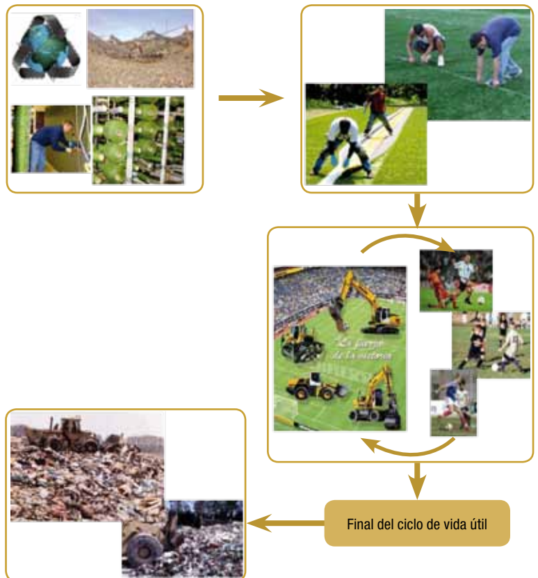
Figura 1. Ciclo seguido en la actualidad por los materiales que constituyen un campo de césped artificial.

La cantidad de material existente en un campo de fútbol en el momento de su retirada es de aproximadamente 100 toneladas. Los materiales que en la actualidad constituyen este tipo de superficies de césped artificial convierten a sus residuos en "no peligrosos", si bien no se evita que deban trasladarse a un vertedero controlado con el coste que ello supone (Figura 1).