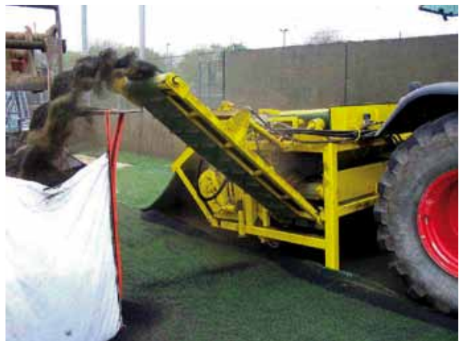
Figura 3. Máquina de retirada de campos y separación de materiales "in situ".