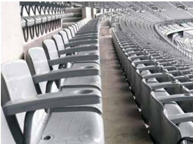
Figura 2. Gradas.

Es importante disponer de requisitos que regulen dichas características desde la etapa de planificación y diseño de la instalación. El IBV ha participado en la redacción de manuales y documentos técnicos de referencia para recoger estas especificaciones. Además, próximamente la Asociación Española de Normalización y Certificación (AENOR) publicará un Informe Técnico (CEN/TR 15913) en el que se especificarán los requisitos de diseño para espacios de visión para espectadores. Con este documento se pretende que dichos espacios cumplan los requisitos necesarios para garantizar la asistencia a los eventos deportivos por este numeroso sector de la población.