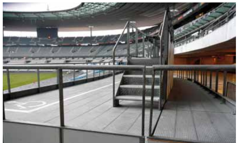
Figura 1. Espacio reservado accesible.

A technical report specifying the characteristics of viewing areas in sports facilities for spectators with special needs will be published soon.