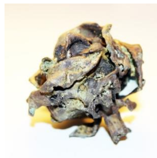
Marta Fernández. Rosa II . Microfusión, 2013.