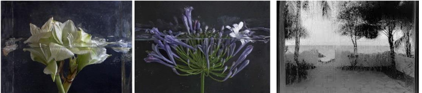
P. Pequeño. Fotografías , 2010.

“En estos paisajes cercanos me estoy fotografiando yo, en un permanente mirar hacia dentro” 7 . P. Pequeño.