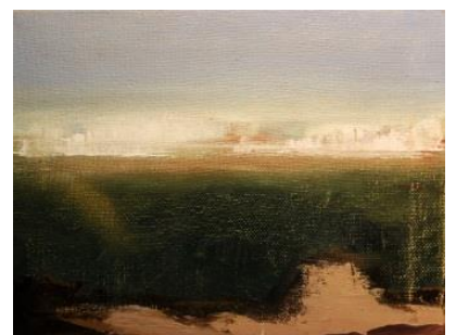
Marta Fernández. Políptico. En aumento . Óleo sobre tabla. 15 x 20 cm. 2014.