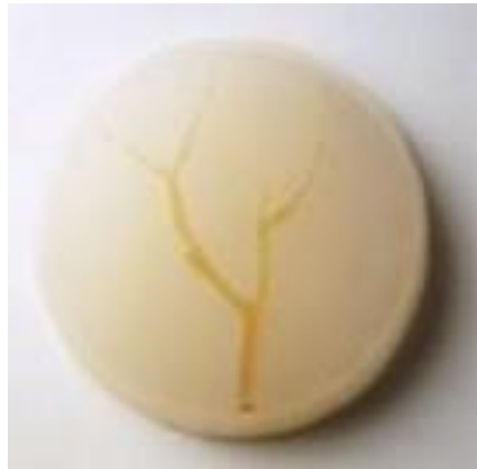
J. GINESTAR. Objeto litúrgico , cera y parafina, 3x 18'5 cm, 2000.