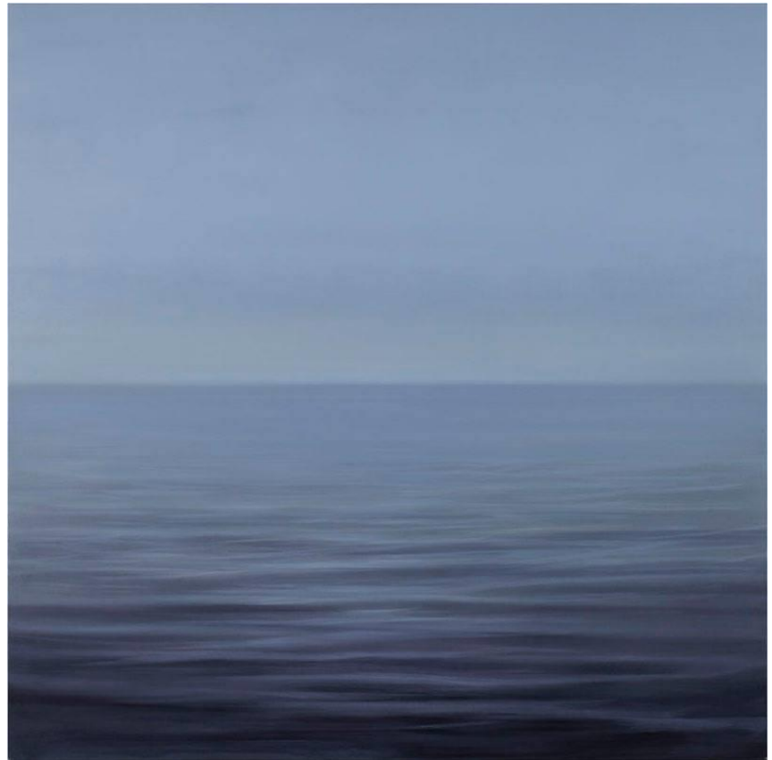
SABORIT, José. Óleo sobre tela, 200 x 200 cm, 2013.

He tomado como referente principal la última exposición del artista en el IVAM. “Más al Sur” es todo un viaje para el espectador, según los comisarios de la muestra “la exposición propone un recorrido que va desde la figuración despojada de anécdota y la reflexión desde paisajes próximos a las vivencias del autor hasta la abstracción. Una llamada a desplazarnos desde el color a la ausencia de éste. Una búsqueda del blanco entendido como la esencialidad, interpretado como un trabajo necesario de despojamiento ante la abundancia icónica del presente para potenciar así la intensidad de nuestra experiencia”. Como contrapunto de unos paisajes amplios, monumentales y lejanos que pasan por el Mediterráneo y el Pacífico hasta el Atlántico, encontramos la serie Doble sombra , que nos habla de lo cercano, del retorno al origen, de vegetales adyacentes al paisaje cercanos al pintor dotados de una gran sensibilidad y carga retórica, ocupándose de manera humilde de lo pequeño.