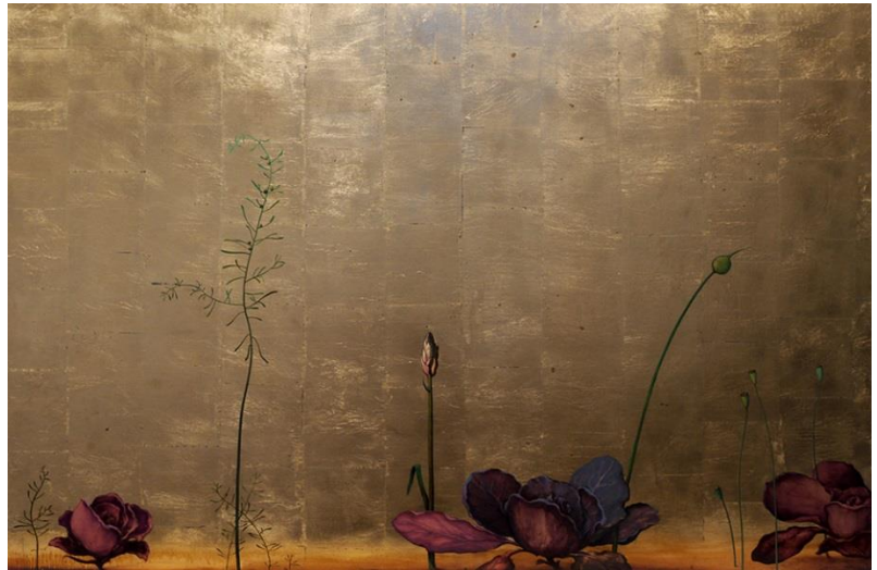
José Albelda: Paseo de Coles y Adventicias , 100 x 1135 cm, T.M. Sobre tabla, 2010.

Qué mejor manera de empezar hablar de un artista que con las palabras de otro: