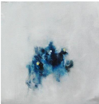
Almudena Millán. S/T. 100 X 100 cm, óleo sobre tabla, 2014.