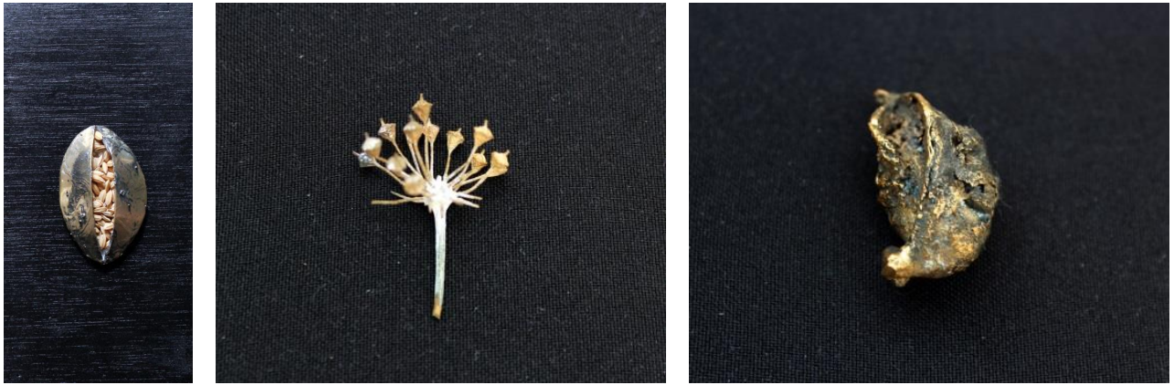
Marta Fernández. Políptico. Geminal , microfusión, cera, latón, bronce y semillas, 2013.

Para crear esta serie de pequeñas semillas de bronce y latón ha sido necesario emplear la técnica de la microfusión, de la que ya habíamos hablado antes pero en este caso guarda una variedad que a continuación explicaré. Es la misma técnica que se usa para fabricar joyería, solo que en esta situación se hace a molde perdido. El primer paso es montar los vegetales en un árbol de cera de un tamaño que no supere en altura y diámetro los cilindros metálicos (hierro, material refractario) donde posteriormente lo meteremos añadiremos un revestimiento que se petrifica creando un molde del árbol, el cilindro se introduce en un horno de fuerza centrífuga que riega el metal por los bebederos llegando hasta los vegetales, a continuación se saca del horno el tubo y se introduce en un cubo con agua fría produciendo un choque térmico que deshace la escayola, cuando el metal se ha enfriado el siguiente paso es proceder a cortar los bebederos con una Dremel o una sierra de marquetería, una vez se han cortado las piezas hay que limar y darle el acabado bien patinando o puliendo la miniatura.