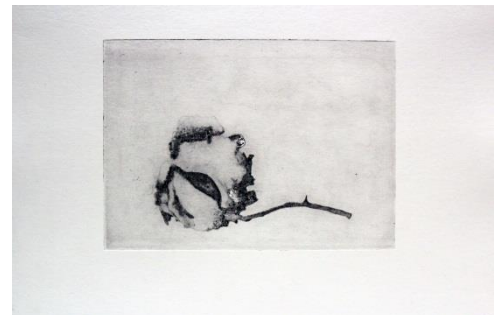
Marta Fernández. Rosa III . Grabado calográfico, Tamaño: A5, 2014.