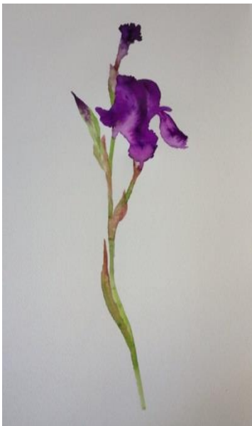
SABORIT, José/Doble sombra. (Diario de agosto, Náquera, 2011).