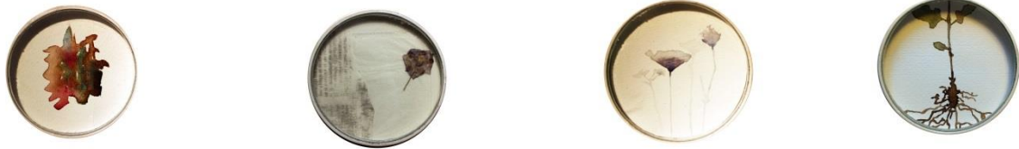
Marta Fernández. Políptico. En aumento . Acuarela sobre papel, 9 cm, 2013/2014.

La serie se compone de 25 acuarelas de formato redondo de 9 cm de diámetro enmarcadas en lupas que he manipulado previamente, cortando el mango, puliendo la zona del corte y pintado la superficie del marco. La metáfora es el elemento retórico principal, pues las lupas actúan como metáfora de una mirada amplificada ante el mundo vegetal pequeño. Esos treinta retratos de vegetales representan una parte de la periferia natural que nos rodea que además actúa de contrapunto con el paisaje y su necesidad de una mirada lejana. Asimismo, existe otra metáfora, que habla del ser humano y la necesidad de ampliar su visión ante lo frágil y perecedero. Coexiste en las acuarelas diversidad, variación botánica, pero se utiliza la repetición como elemento fundamental, puesto que por una parte tenemos repetición del tipo icónico (los vegetales), y por otra, repetición del modo de representarlos amplificándolos, con los marcos-lupa.