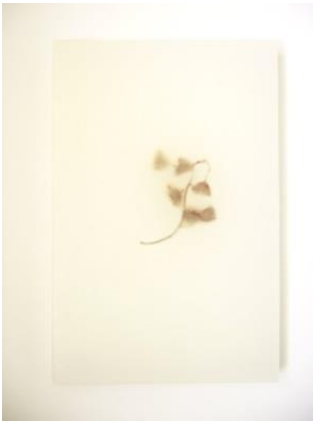
J. GINESTAR. Objeto litúrgico , cera y parafina, 2000.