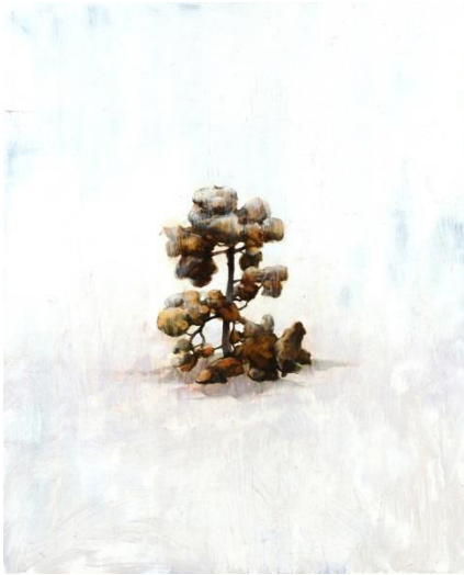
José Albelda: Retrato de soledad I , 55 x 45 cm, T.M. Sobre tabla, 2009.