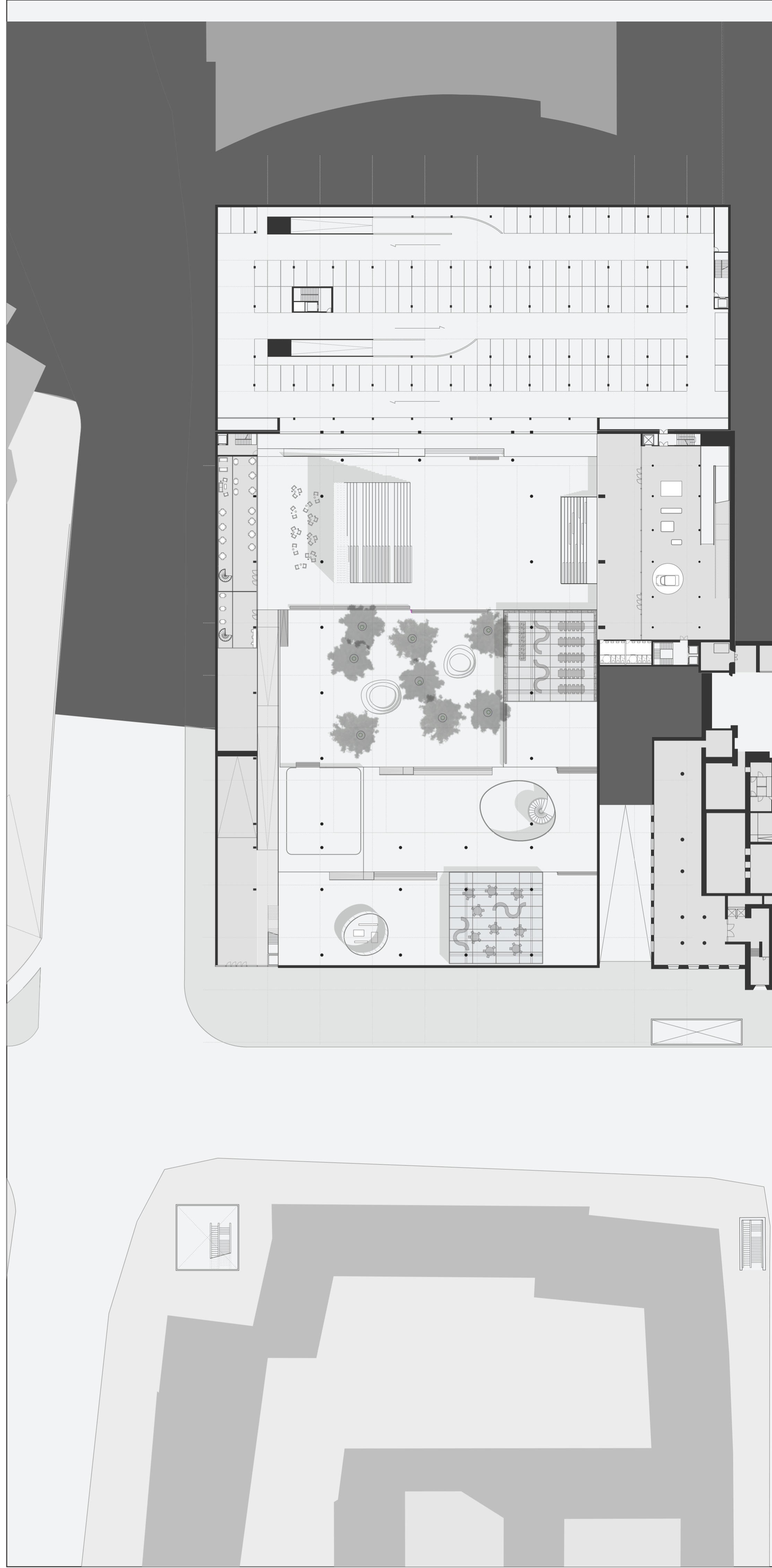
Planta nivel calle. Cota -4 sobre nivel nave Escala : 1/500