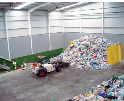
Tabla 6. Parámetros de clasificación del CSR.

Como conclusión al estudio, se puede estimar que de las 507.001 t de residuos que entraron a las PSE en el año 2010, 214.613 t se convirtieron en rechazos (el 42,33%). De esta cantidad, el 91,49% es mate-