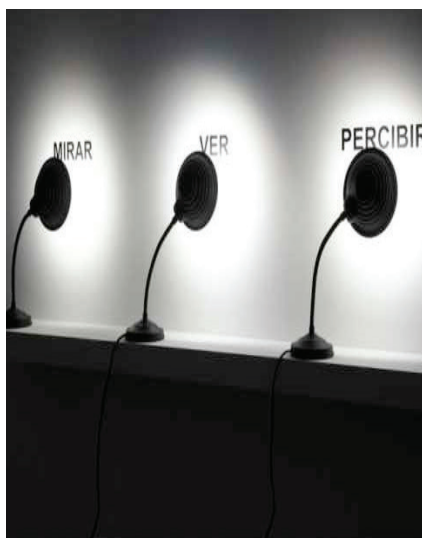
7. Exposición realizada en el Museo Nacional Centro de Arte Reina Sofía por Muntadas, 2011.