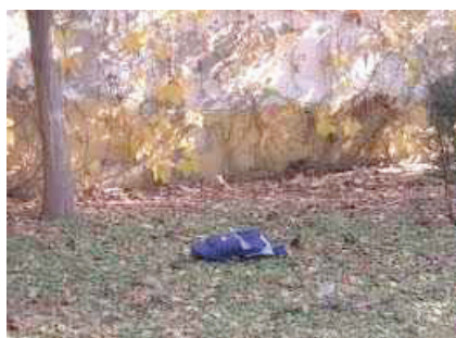
14. Cárcel situada en el Arco de Regla.