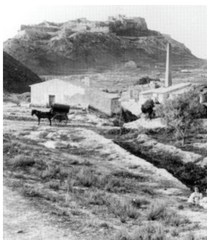
12. Cárcel Modelo (Valencia)

La adquisición de información ha sido una tarea complicada puesto que a pesar de que la búsqueda es sobre un tema de gran relevancia histórica, las políticas actuales parecen no estimular ni fomentar el acceso a ellas, bien porque no existen demasiados datos o bien porque no se estima relevante facilitarlos. Por esto, las fuentes que me han permitido obtener datos sobre el tema proceden de internet.