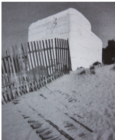
3. Campo de concentración "La Almadraba"