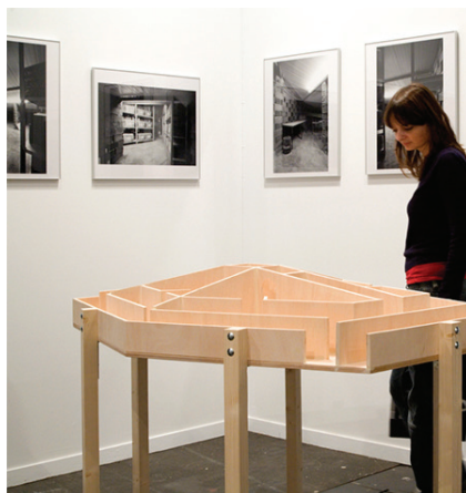
5. Archivo Espartaco-Los colectivizadores , 2008