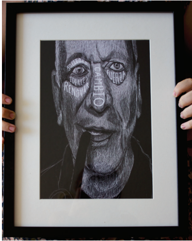
18. Una de las diez ilustraciones finales realizas.