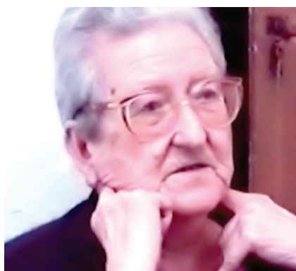
17. Imágenes analógicas y digitales del proyecto.