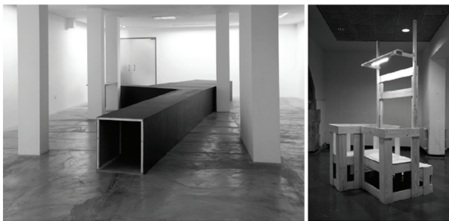
6. La Madriguera , 1970. Teórica y práctica, 2008.

intentaron generar formas nuevas y diferentes, de relación social.