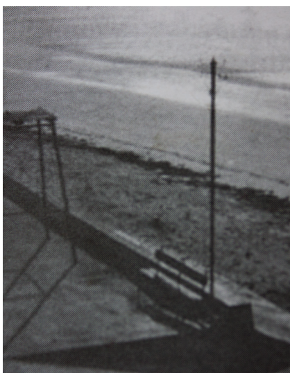
4. Lugares en los cuales eran fusilados los milicianos.

una guerra en el sentido estricto de la palabra, se realizaron atrocidades imaginables... (última frase copiada)