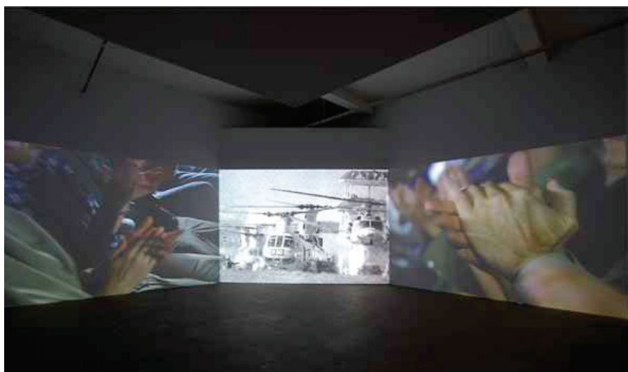
8. Instalación Aplausos , Muntadas.