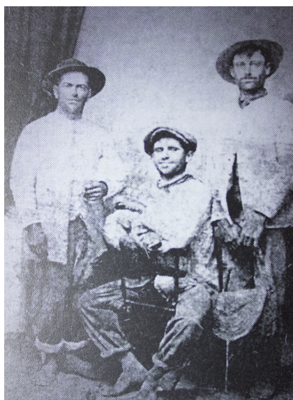
1. Fundadores del bando republicano roteño.