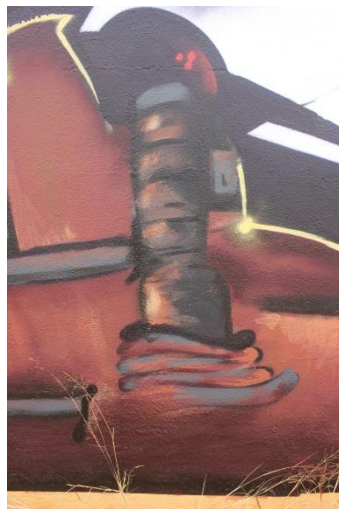
9 Detalle de fabrica

Para comprender al máximo todo el mural se debe recurrir a la canción, que a continuación se reproducirá de manera simultánea junto con el video montaje del proceso, para facilitarnos de este modo, la comprensión de la pintura y la representación gráfica de la canción.