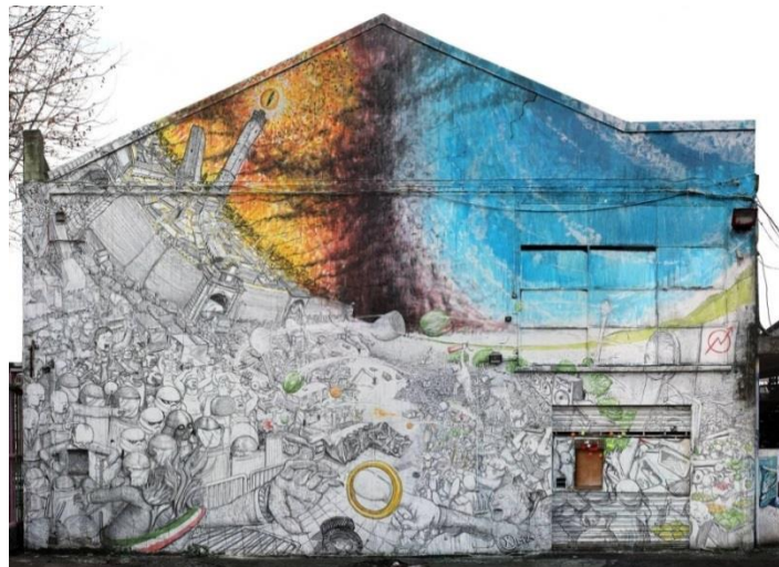
1. Blu en Bologna

Anexare el enlace correspondiente al montaje de animación “MUTO”, que lo dio a conocer en el 2008 a través de la red.