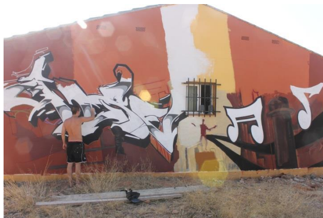
8 Avance del mural, contorno de la pieza de graffiti

Por simple comodidad de trabajo se dividió en cuatro partes que trabajaremos lo más simultáneamente que se pueda. De modo que se buscó realizar la pintura desde abajo hacia arriba para así reducir los momentos que había que pasar encima del andamio y las veces que lo moviese, ya que este tiene un peso considerable y la superficie es rocosa.