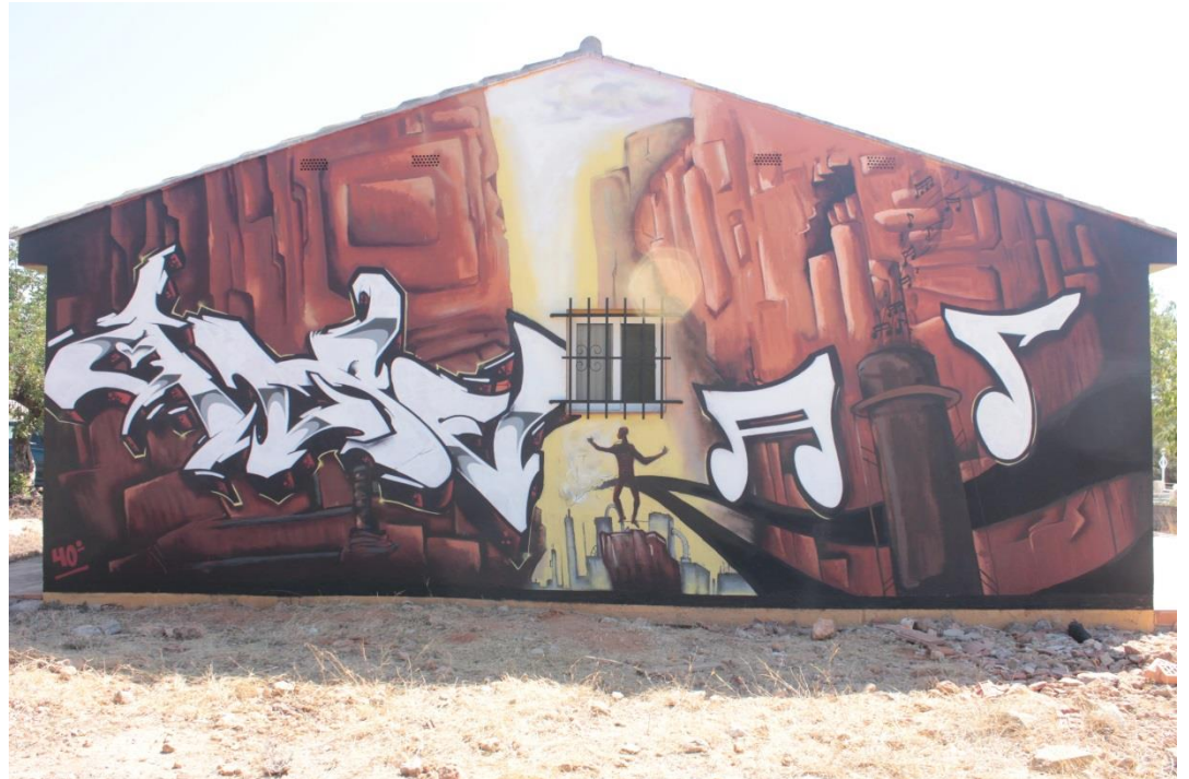
12 Resultado final, a contraluz , del mural

Lo ultimo que se dispuso a realizar tiene como objetivo la documentación personal de proceso del mural, así como la interrelación de ambos módulos en el mismo contexto. Se creará un sencillo video en el cual se alternan tomas y se edita mínimamente para volver a juntar los dos módulos en uno solo. Como ya se citó en un principio, se dividió el proceso en dos módulos solo para poder explicarlo