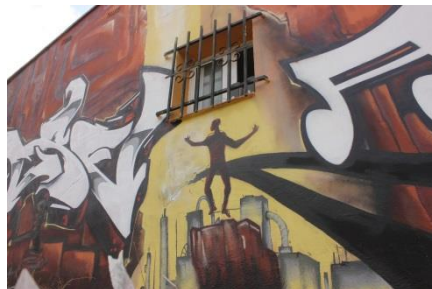
10 Seccion central, fábricas y Niño mecanico