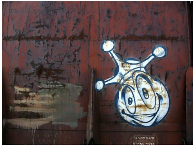
3 Duke Carita sonriente representative