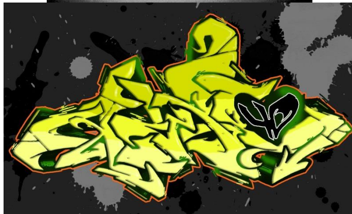
5 Bocetos escaneados y retoques a photoshop para simular resultados previos a la eleccion del bueno.