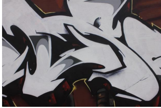
11 Detalle Pieza " Alse " contornos y relleno