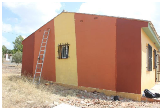
4 Fotografía del muro esquematizado

En base a esto nos dispusimos a trabajar el material. Tomando medidas, fotografías escalas para tener los números exactos sobre los que trabajar con los motivos que tenemos que dibujar y preparar.