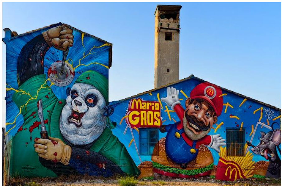
2 Duke mural Mario Gross, Valencia

Duke103 comenzó en los años noventa en las calles de Valencia, pintando de manera ilegal desde paredes, pasando por trenes, incluso autobuses, algo que desapareció con el paso de los años en la ciudad. Poco a poco fue derivando su estilo hacia la pintura mural pero siempre manteniendo la esencia que da el aerosol en su estilo más clásico. Quizá la característica más notable de este escritor de muros es la metáfora visual de la que dota a sus grandes personajes que forman parte siempre de una temática social crítica con el estado, y en ocasiones con la policía. Siempre bajo el trasfondo del ataque visual al poder. También es destacable como parodia nuevas culturas irracionales, como la tendencia al uso de esteroides en el gimnasio, tan solo un ejemplo.