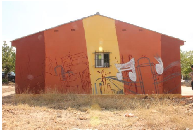
7 Marcaje inicial del mural, ventana central.

de este momento la realización del muro entrará en el clásico bucle que suele sucederse en el mundo del graffiti muy a menudo, pintando de lo más general a lo más detallado con capaz que se superponen las unas a las otras.