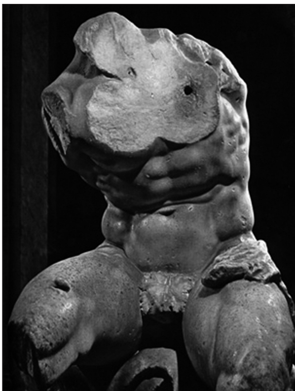
IMAGEN 2. Torso Belvedere , Apolonio de Atenas, siglo I aC (copia de original ca. Siglo II aC), Museo Pío-Clementino, Museos Vaticanos , Roma.

en la que, como decíamos, lo bello y lo sublime, la actividad y la pasividad, se reúnen en una misma experiencia estética 5 .