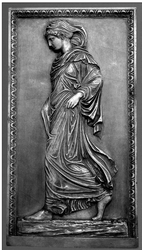
IMAGEN 4. Gradyva , relieve romano (s.f.), Museo del Vaticano.

tación freudiana [afirma Rancière] retrotrae las historias de ruido y de furia a la lógica aristotélica del encadenamiento de causas efectos, cuyo poder de sorpresa y dolencia amorosa está ligado al perfecto rigor que posee 8 . Ruido y furia son sometidos al encadenamiento causal en la literatura y el arte, tal como el síntoma y la imagen onírica del paciente en el diván del psicoanalista constituyen significantes aislados que sólo cobran sentido en relación a una cadena narrativa construida en el proceso terapéutico y en relación a la novela familiar.