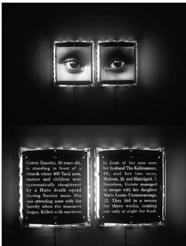
IMAGEN 5. A. Jaar, fragmento de la instalación The Eyes of Gutete Emerita , 1996.

espectador siente al contemplar la imagen no excluye en modo alguno, para Rancière, la conciencia de las múltiples operaciones que en la imagen se condensan ( studium ).