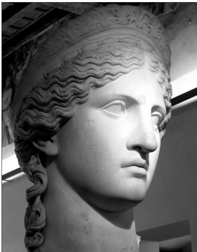
IMAGEN 1. Juno ludovisi , siglo I dC, Museo Nacional, Palacio Altemps, Roma,

contradicción entre el carácter estético y autónomo de la obra y su finalidad heterónoma, extra-artística, político-instrumental o, como propone Rancière, metapolítica .