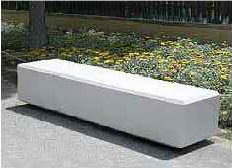
Los bancos estarán elaborados "in situ" y serán construidos con hormigón armado. Se trata de un prisma compacto que se apoya sobre un zócalo rebajado que lo hace levitar. Las dimensiones serán de 60 cm. de anchura y 40 cm. de altura (incluyendo el zócalo inferior).