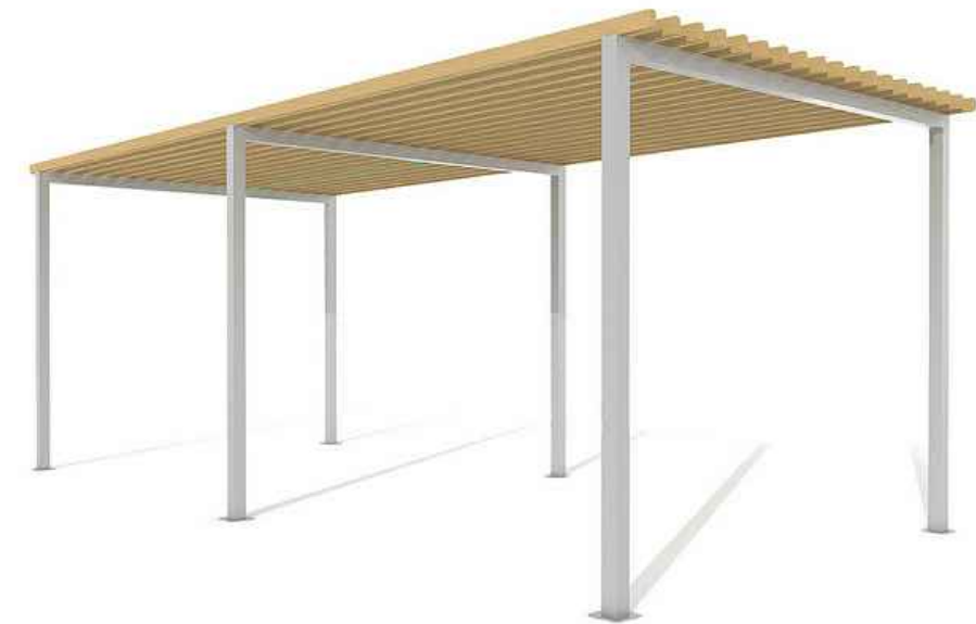
Pergola construida con pilares, perfiles metálicos y lamas de madera de cubrición. Altura 3,50 m.