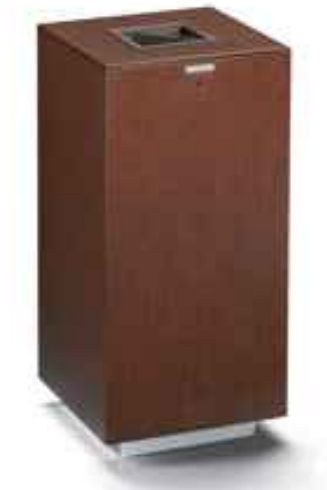
Tanto las papeleras como las fuentes exteriores serán de acero corten. Ambas mantienen geometrías prismáticas.