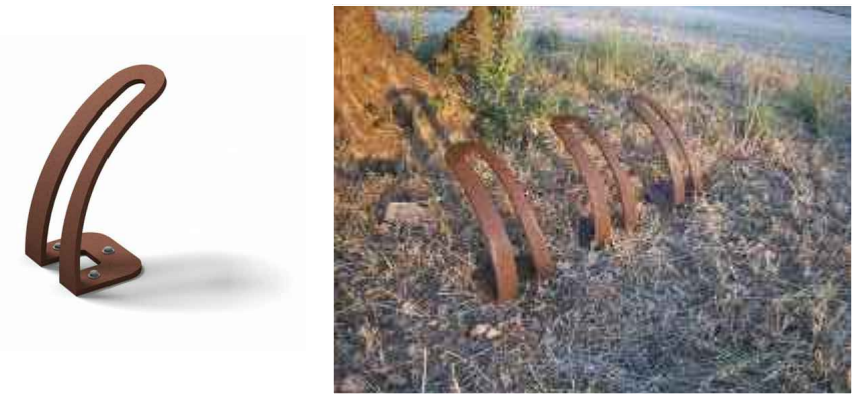
Aparcabicis de chapa de acero corten, atornillados al suelo y a una distancia que permita la colocación de varias bicis consecutivas.