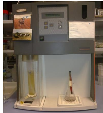
Fotografía 4. Método Kjeldhal.