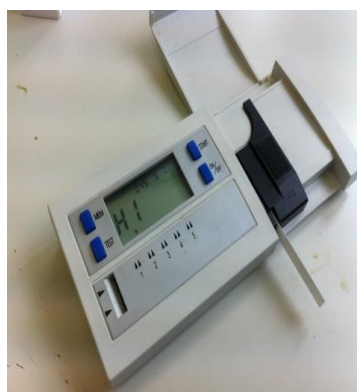
Fotografía 6. Medidor de nitratos por reflectometría.