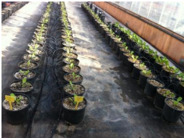
Fotografía 1. Experimento en invernadero