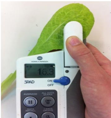
Fotografía 3. Medidor portátil de clorofilas SPAD.