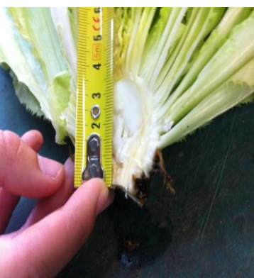
Fotografía 5. Medida del esbozo floral.