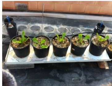
Fotografía 2. Drenaje de las plantas