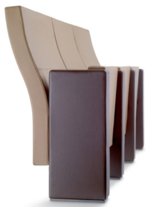
Asientos modelo Line de Figueras