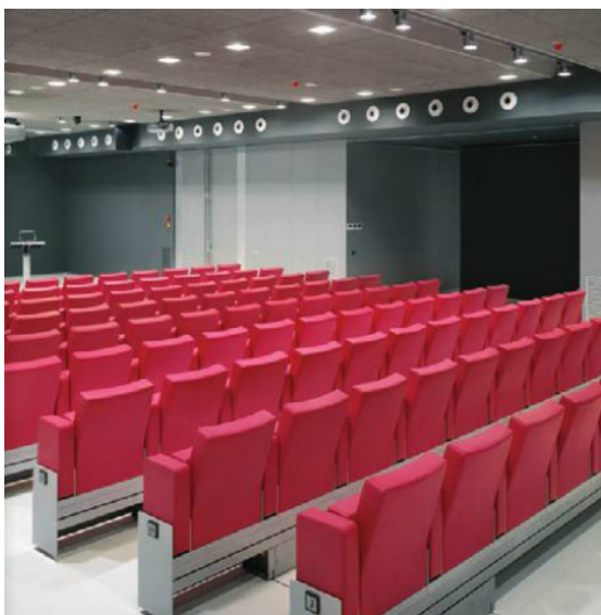
Sistema de liberación y recogida de los asientos en la sala.