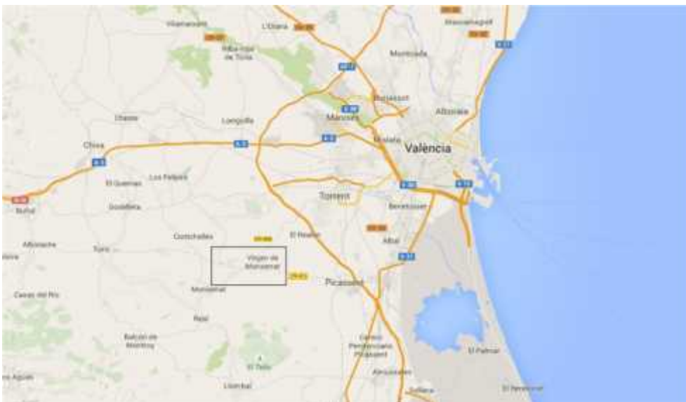
Figura 2 - Localización (II)