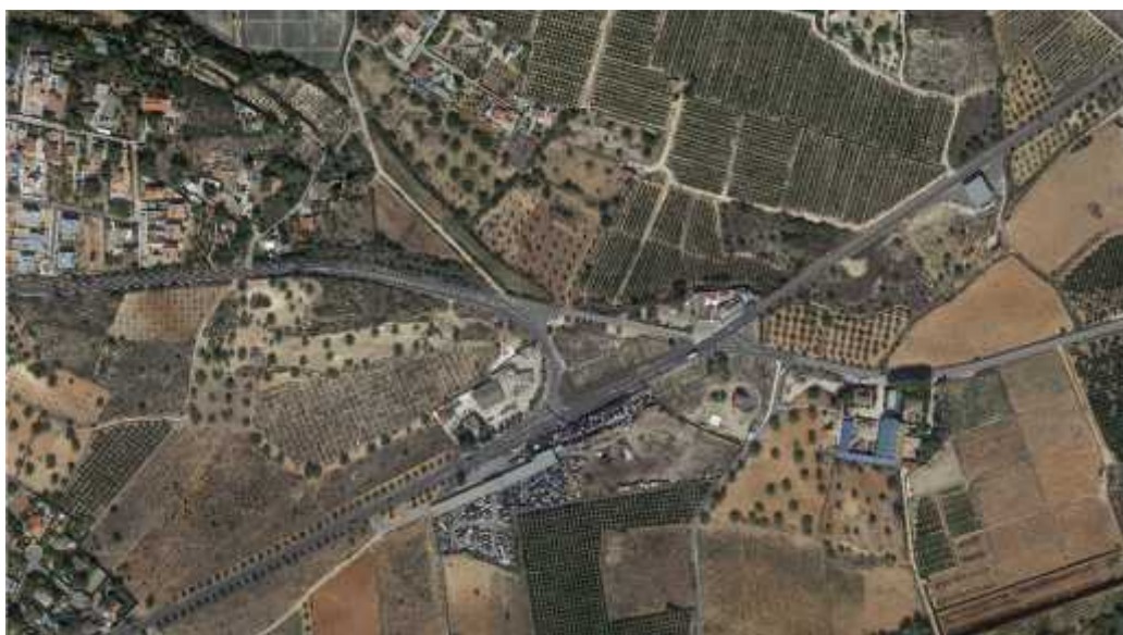
Figura 3 - Localización (III)