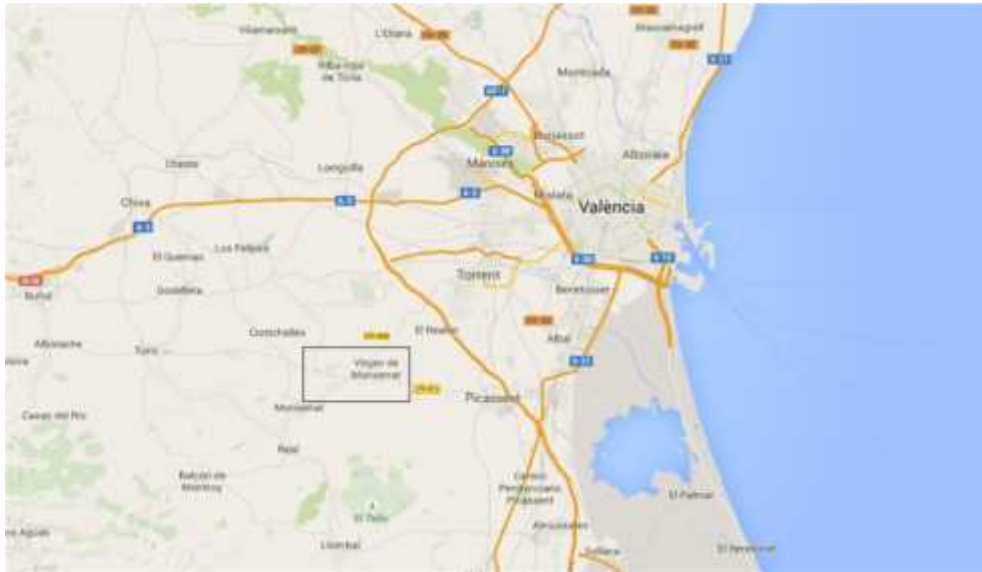
Figura 2 - Localización (II)