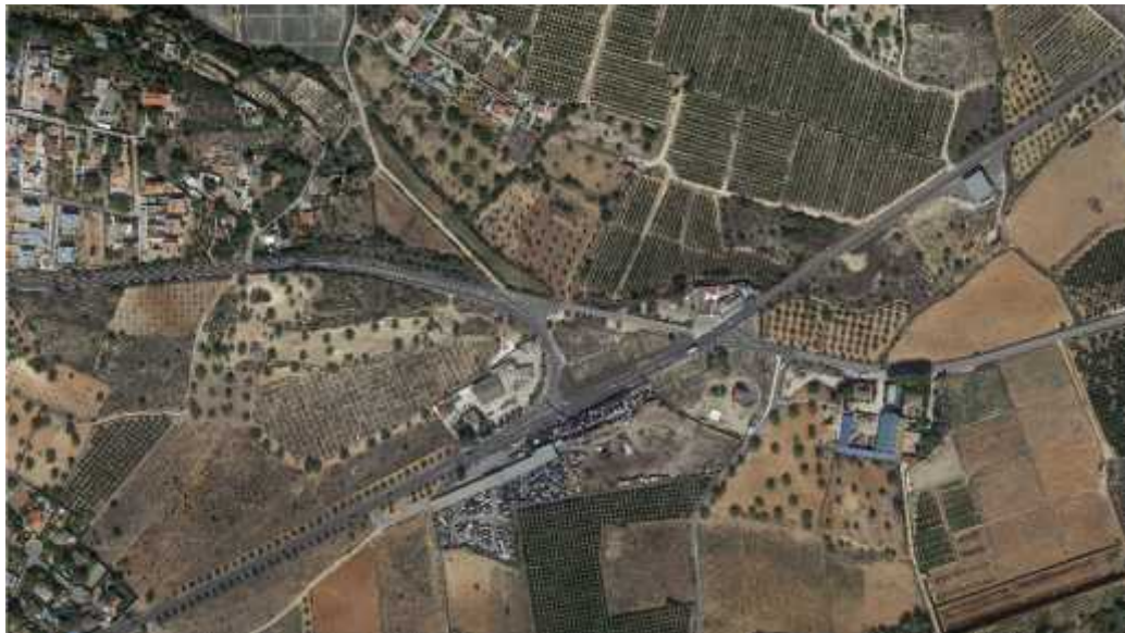
Figura 3 - Localización (III)