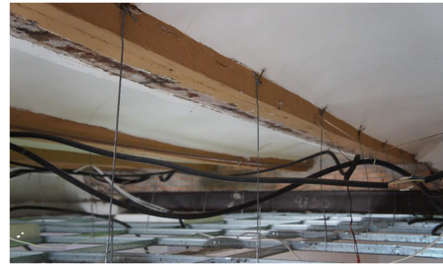
Lesión 7: Deformaciones Localización: Viguetas del forjado P1