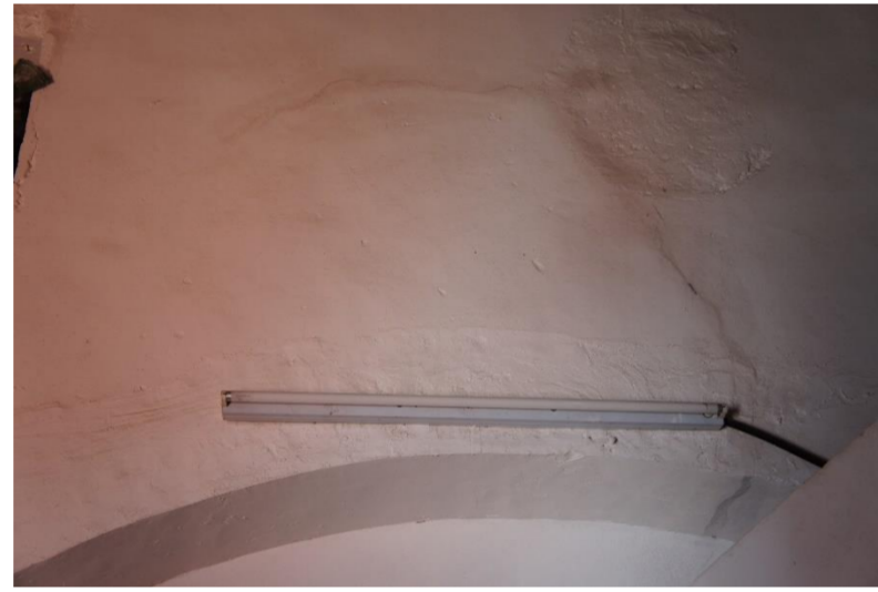
Lesión 5: Grietas en arco Localización: Arco bajo cumbrera