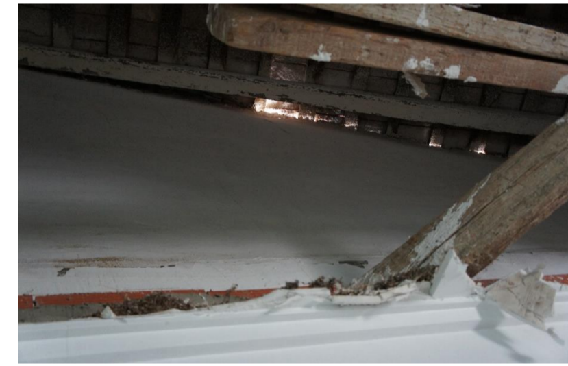
Lesión 8: Desprendimientos Localización: Cubierta inclinada