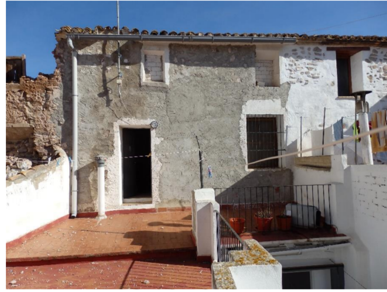
Lesión 1: Perdida material de la superficie Localización: Fachada posterior