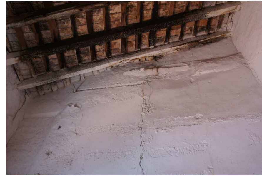
Lesión 3: Grietas en el muro Localización: En paño muro y medianera