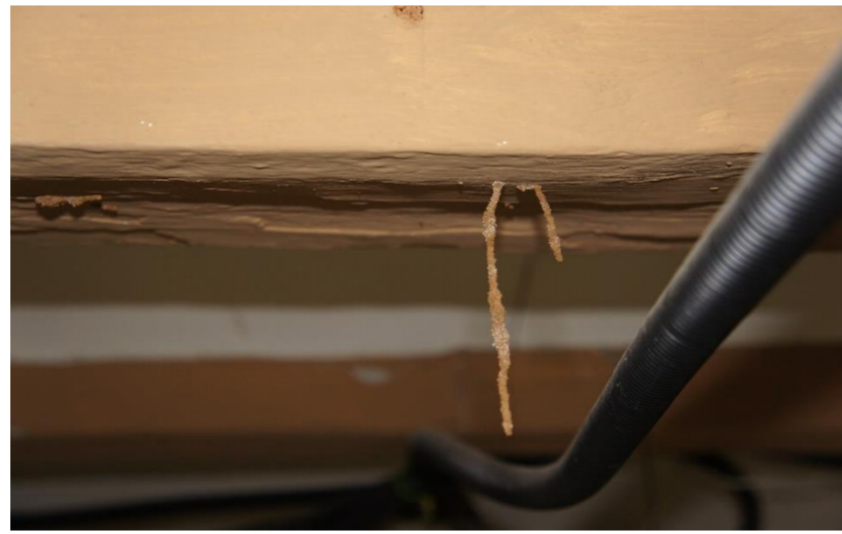
Lesión 6: Ataque biótico – Termitas Localización: Viguetas del forjado P1