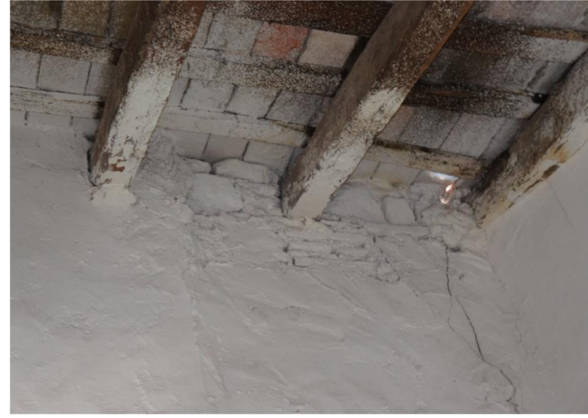
Lesión 2: Grietas en el muro Localización: Fachada posterior