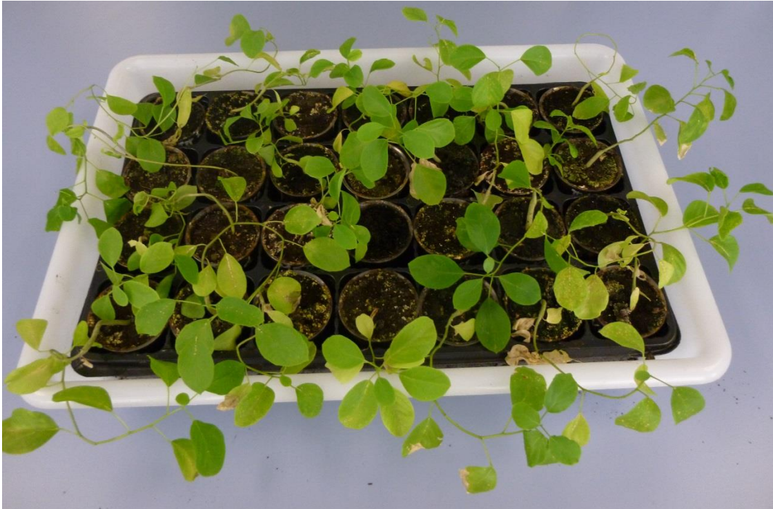
Fotografía 3.- Bandeja de plantas de alcaparro