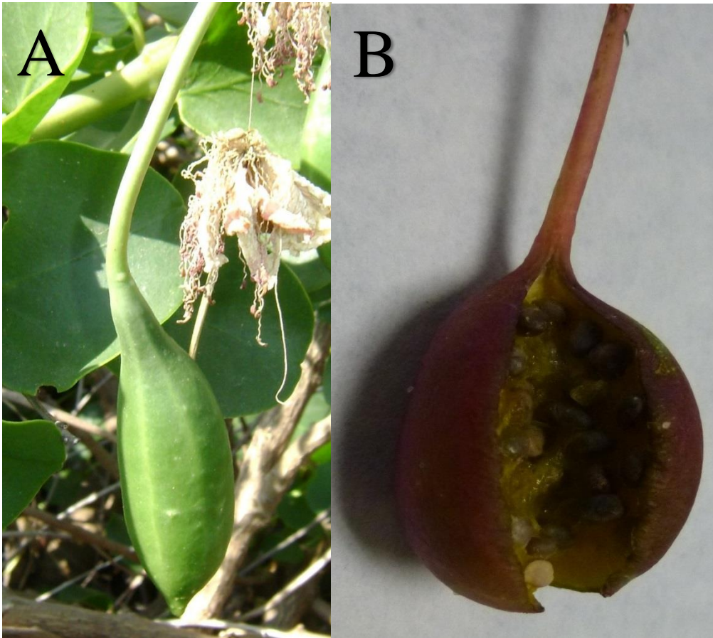
Fotografía 10. – Detalles del fruto del alcaparro. A, fruto en la planta. B, fruto abierto