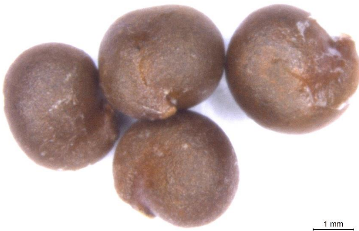
Fotografía 11.- Detalle de las semillas de alcaparro