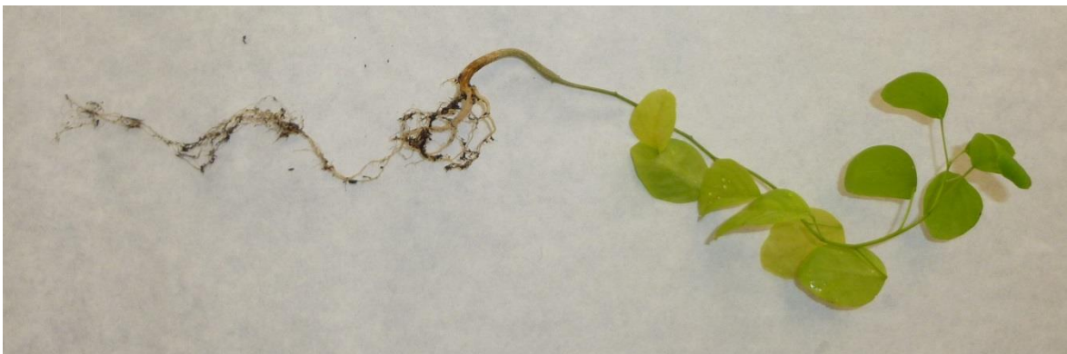
Fotografía 4.- Detalles de la planta de alcaparro