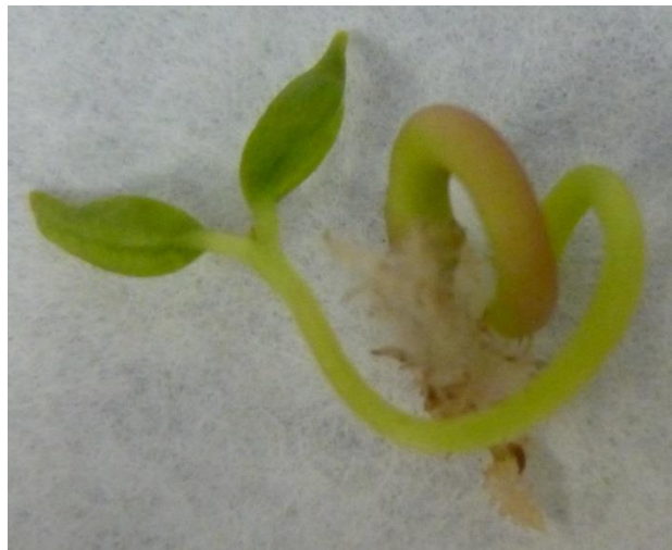
Fotografía 12.- Detalles de las fases de germinación de la semilla de alcaparro