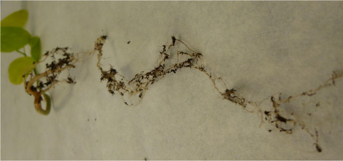
Fotografía 5.- Detalles de la raíz de alcaparro