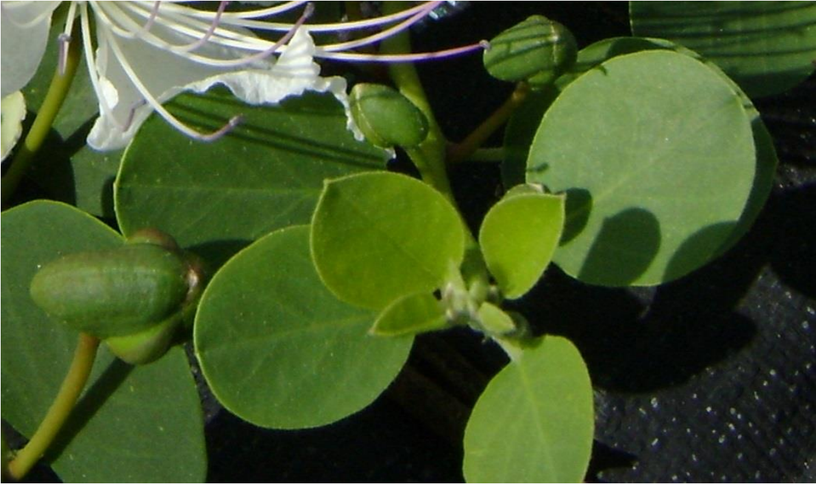
Fotografía 7. – Detalles de las hojas del alcaparro