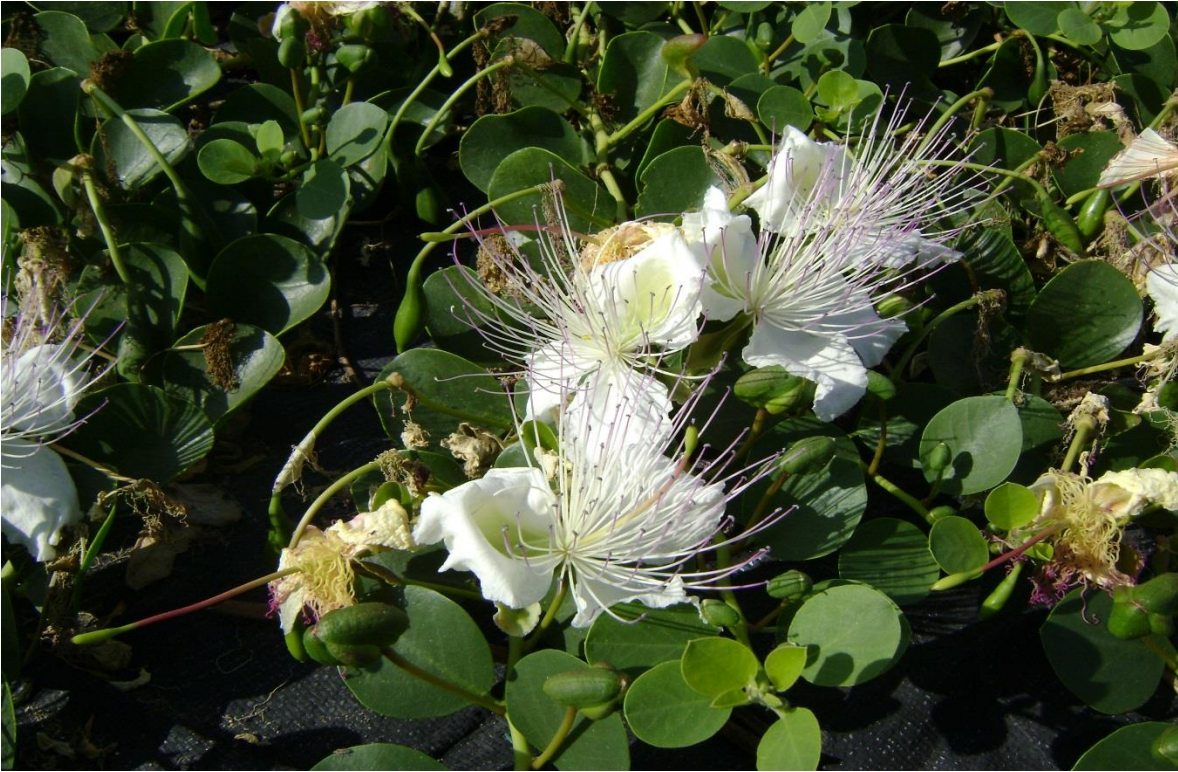
Fotografía 8. – Detalles de las flores del alcaparro