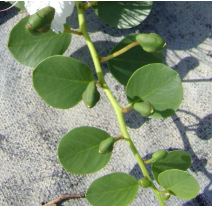
Fotografía 9. – Detalles de los botones florales del alcaparro