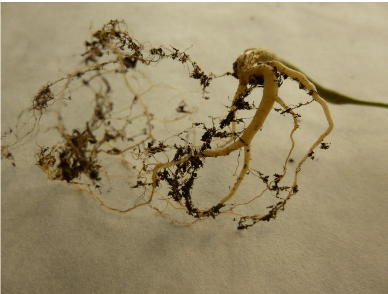
Fotografía 6.- Detalles de la raíz de alcaparro 2