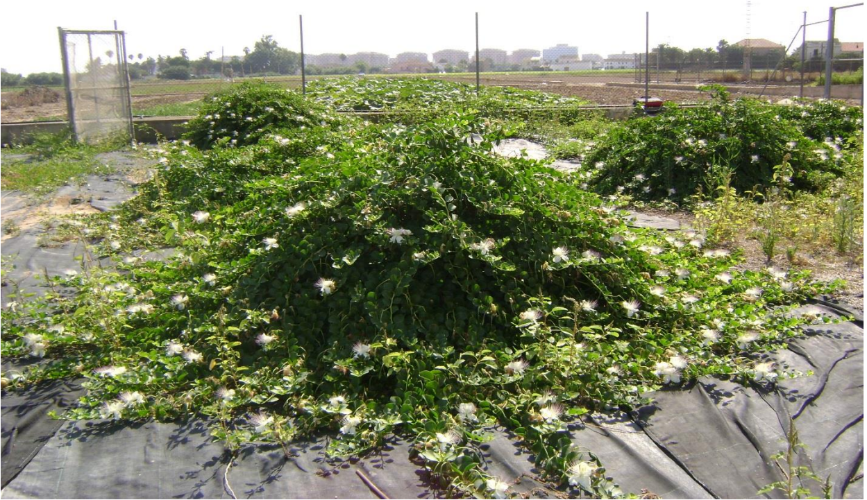
Fotografía 2.- Planta de alcaparro.