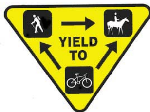
Figura 5: Codi d'etiqueta o cortesia de pas (© National Park Service )

També cal parlar sobre el 3.1 % d'usuaris que acudeixen al PFT per muntar a cavall. Tot i que no representen un grup molt gran entre el total d'usuaris si que són un col·lectiu molt visible, que s'ha de tenir molt en compte a l'hora de pensar en la gestió recreativa. De fet el National Park Service ha desenvolupat un codi d'etiqueta per a aquelles situacions en que un espai és compartit per ciclistes, usuaris a peu i usuaris a cavall (Figura 5).