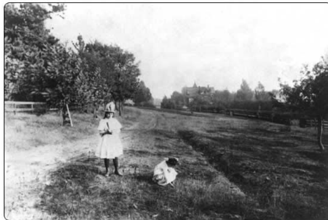
Figura 1: Piedmont Way cap al 1880

En Charles Beveridge, al seu llibre Frederick Law Olmsted: Designing the American Landscape (1995) assenyala en Olmsted com al primer en proposar aquest terme en Park and Piedmont Way Plan (1865) (Figura 1) que incloïa un enllaç entre el campus del College of California (Berkeley) i la ciutat d'Oakland als EUA. Cal remarcar també que tot i ser un personatge molt present a les bibliografies, en Olmsted tingué contemporanis i deixebles com Charles Eliot, Horace William S. Cleveland i George E. Kesler entre d'altres que van treballar aquest camp (Newton, 1971).