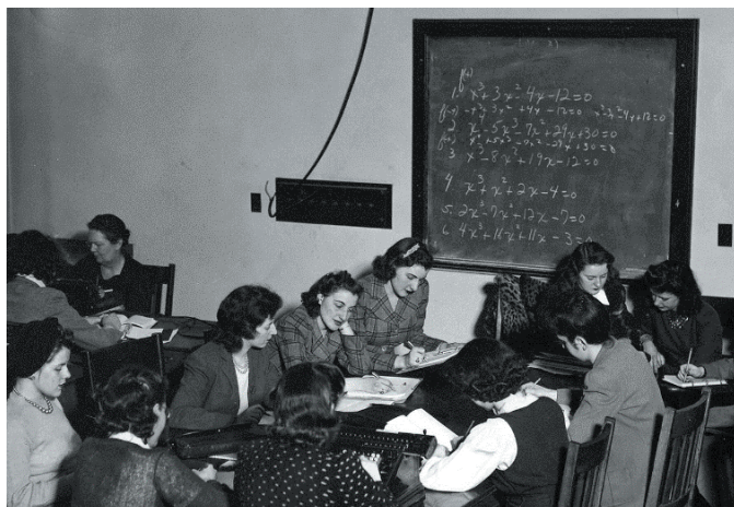
Figura 4. Mujeres calculistas ( computers ) ca. 1942.

“ A cien años de distancia, Grace Hopper se aperció de que podía reutilizar cintas perforadas que llevaban a cabo cálculos específicos en programas distintos, con lo que perfeccionó el concepto de subrutina ”