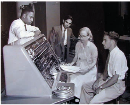
Figura 3. Grace Hopper y otros programadores con el UNIVAC, ca. 1957.

Hopper también contribuyó a difundir el uso de debugging , un término entonces conocido y empleado en otros ámbitos como sinónimo de “error técnico”, para identificar el proceso de eliminación de errores en los programas. A pesar de que desmintió ser la creadora del término, a la comunidad informática le resulta simpático creer que el origen de la palabra se debió a la localización, por parte de Hopper y su equipo, de una polilla ( bug en inglés) en un relé que impedía el funcionamiento correcto del Mark II, un hecho que sí les ocurrió en realidad en 1947; todavía se puede ver el bicho, un poco maltrecho por el paso de los años, pegado con cinta adhesiva en el diario de operación de la máquina.