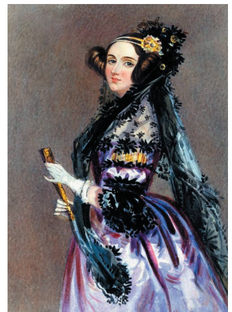
Figura 2. Ada Byron. Retrato de Alfred E. Chalón, ca. 1A838.

En las Notas, Ada destaca el carácter universal de la Máquina Analítica y el papel de las tarjetas perforadas en su funcionamiento, las cuales le permitían programarse y reprogramarse. En este sentido, Ada supo comprender y apreciar la belleza de este nuevo potencial, que expresó en la Nota A usando el lenguaje poético de su padre: “Podemos decir, muy apropiadamente, que la Máquina Analítica teje dibujos algebraicos , de igual modo que el telar de Jacquard teje flores y hojas”. También enfatizó la habilidad del salto condicional y la reutilización de ciertas listas de instrucciones, esto es,