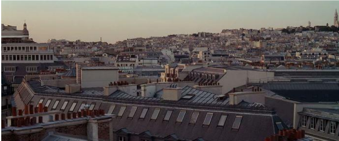
IMAGEN 10 y 11: Plano general del París y Bombasa. (22:09)