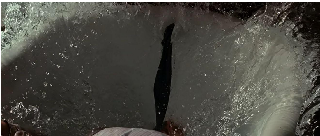
IMAGEN 15: El sueño de descompone