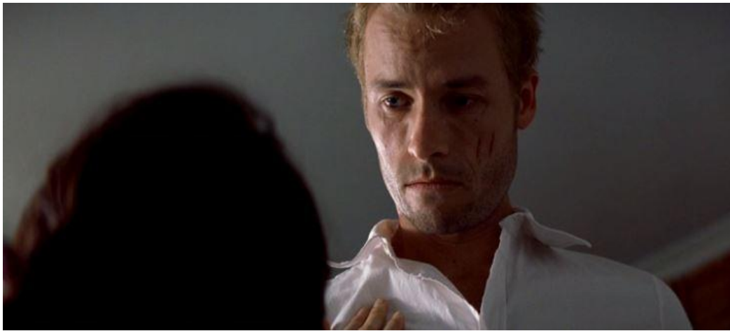
IMAGEN 6: Poca profundidad de campo.