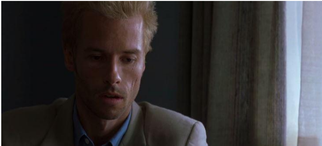
IMAGEN 8: Colores fríos en la noche.