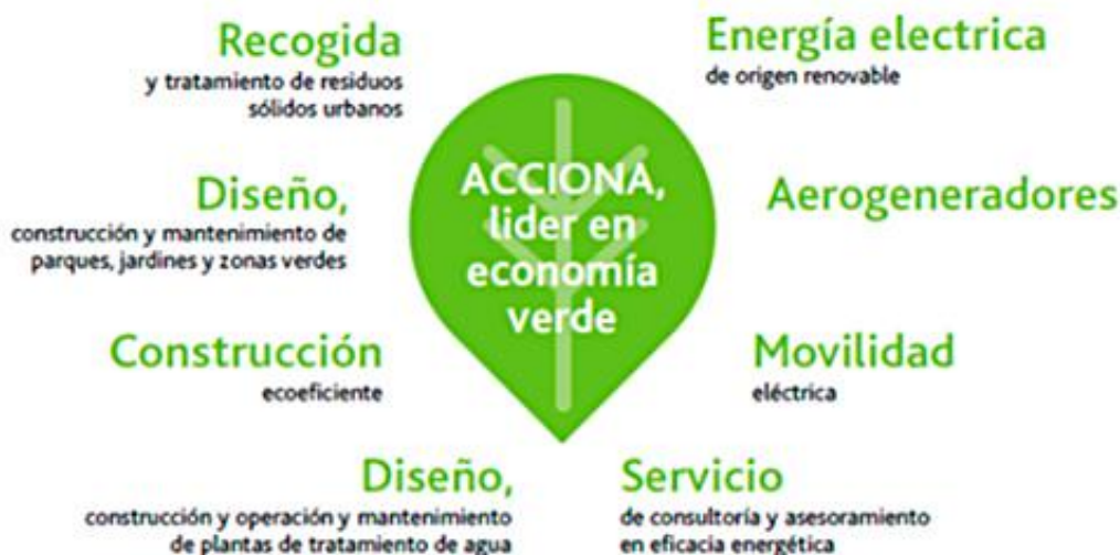
IMAGEN Nº 4: PLAN ECONOMÍA VERDE. www.accion.es