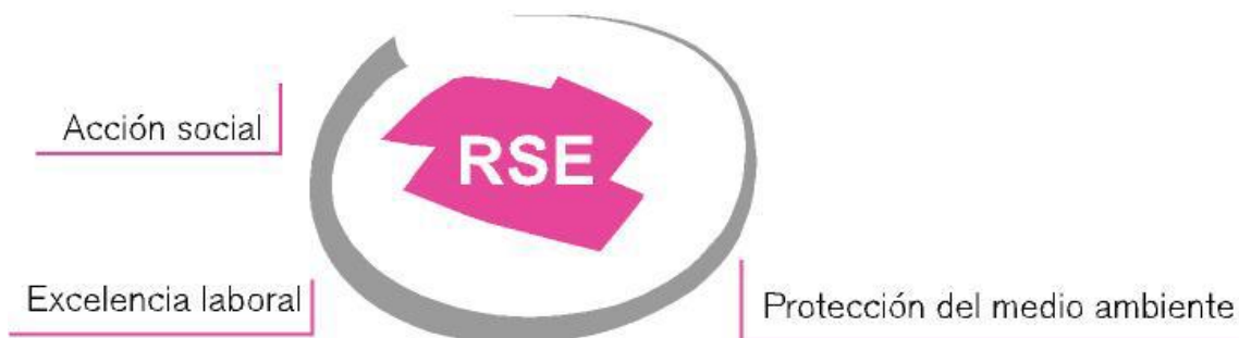
IMAGEN N°1: Elaboración propia.

Así pues, el objetivo final de nuestro TFC es señalar la importancia de implantar prácticas de RSC en las empresas, tanto privadas como públicas, de forma voluntaria en todas sus operaciones de negocio que llevan a cabo diariamente para obtener un desarrollo sostenible, lo que satisface las necesidades de las generaciones presentes sin comprometer las necesidades de las generaciones futuras, es decir conseguir un equilibrio.