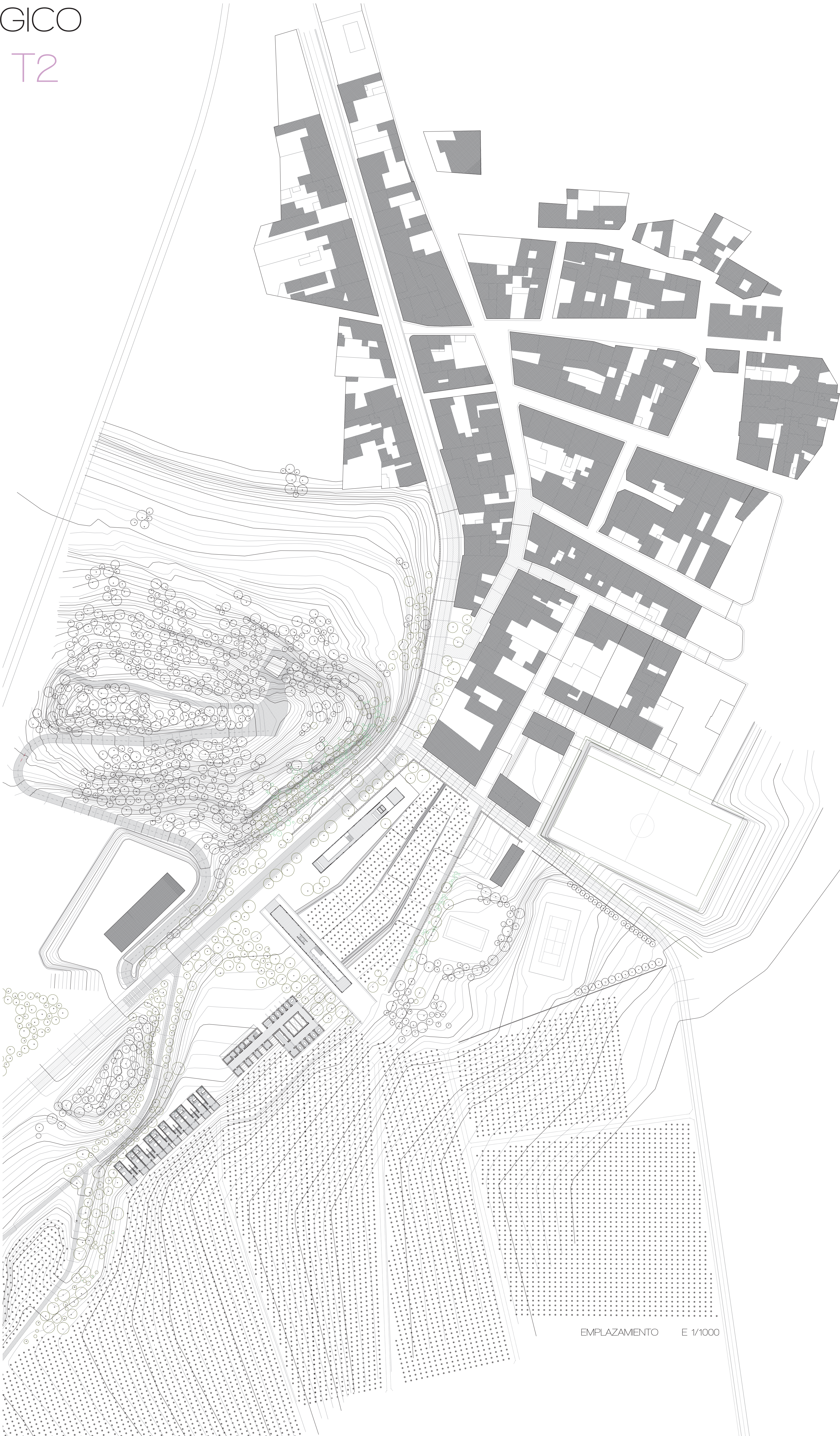
EMPLAZAMIENTO E 1/1000