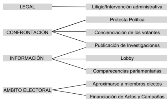
Figura 1. Estrategias y tácticas de representación de intereses de un GI.

Estrategias y tácticas de representación de intereses de los GI: