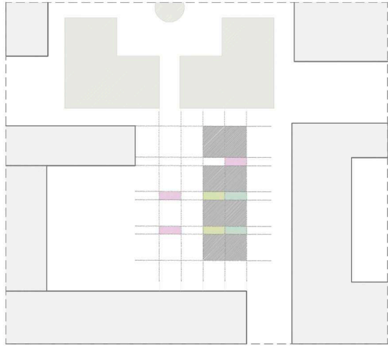
Planta baja - Comunicación - Patios de luz - Servicios