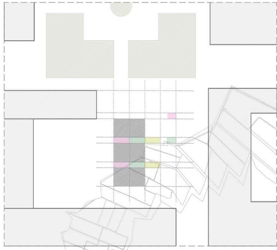
Planta primera - Comunicación - Patios de luz - Servicios