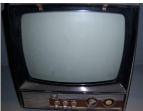
FIGURA 5. Televisión Thomson