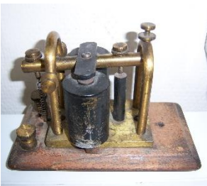
FIGURA 6. Acústico Morse

Con la realización de consultas en el apartado de materiales, podremos saber qué material es más habitual entre los objetos y relacionar de forma directa materiales y deterioros estudiando los nexos comunes.