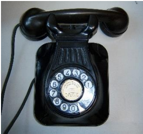
FIGURA 3. Teléfono