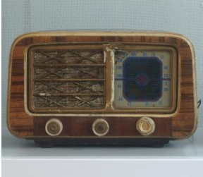
FIGURA 7. Radio