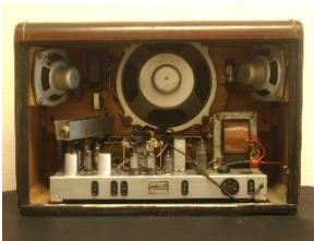
FIGURA 8. Radio

ya que presentan dos tipos de deterioros, los deterioros en materiales (Figura 7) y los presentes en el mecanismo de las piezas (Figura 8), por lo que se ha planteado de otra manera.