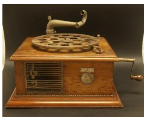
Figura 2. Gramófono

El listado de materiales que aparece en el nuevo formulario, se ha realizado a partir de los materiales que se presentan en las piezas. Son las referencias de materiales que más han aparecido en la estructura de los objetos. Los materiales que se presentan son: madera (Figura 2), plástico (Figura 3), tela (Figura 4), vidrio (Figura 5) y metal (Figura 6), siendo ésta una lista abierta como ya hemos indicado con anterioridad. Con el tiempo, se podrá aumentar la lista, en caso de nuevos materiales, o para especificar el tipo de material, dentro de los que ya se presentan.