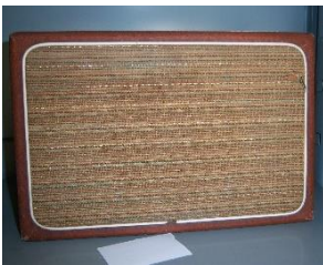
FIGURA 4. Altavoz RCA