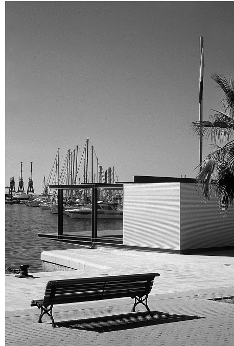
Pabellón de servicios. Puerto de Alicante.

dable) se resuelve en su totalidad con técnicas de construcción en madera, eligiendo para cada componente el producto mas apropiado según el papel a desempeñar en el conjunto. Para ello se emplean los siguientes materiales y sistemas: