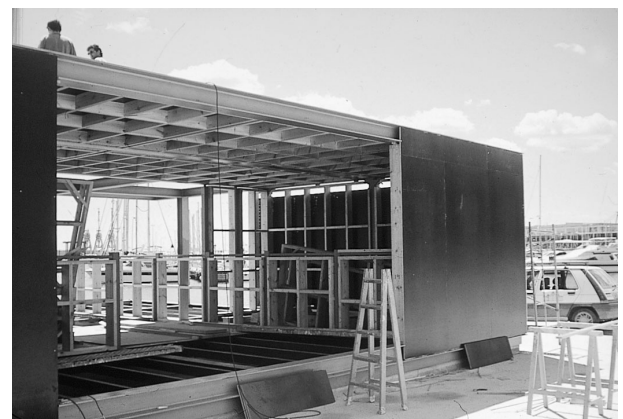
Muelle y pabellón de servicios (fase constructiva). Puerto de Alicante.