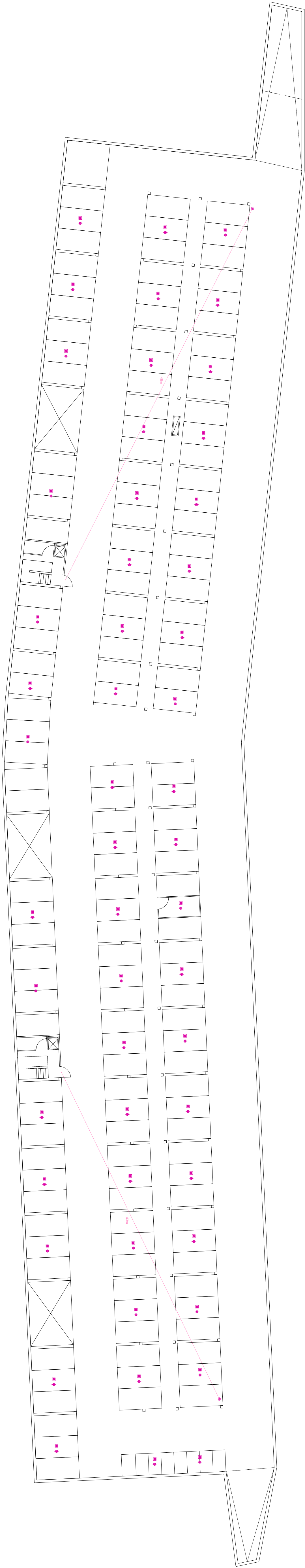
planta aparcamiento e. 1/250