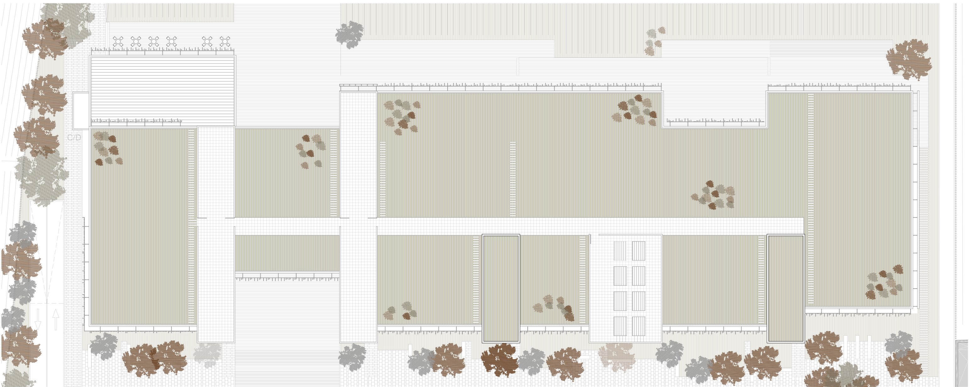
Planta Cubiertas Escala 1:400

Origen australiano Sopota bien los suelos pobres y es sensible a las heladas Crecimiento rapido Forma esferica e irregular, de follaje delicado con flores Sombra media