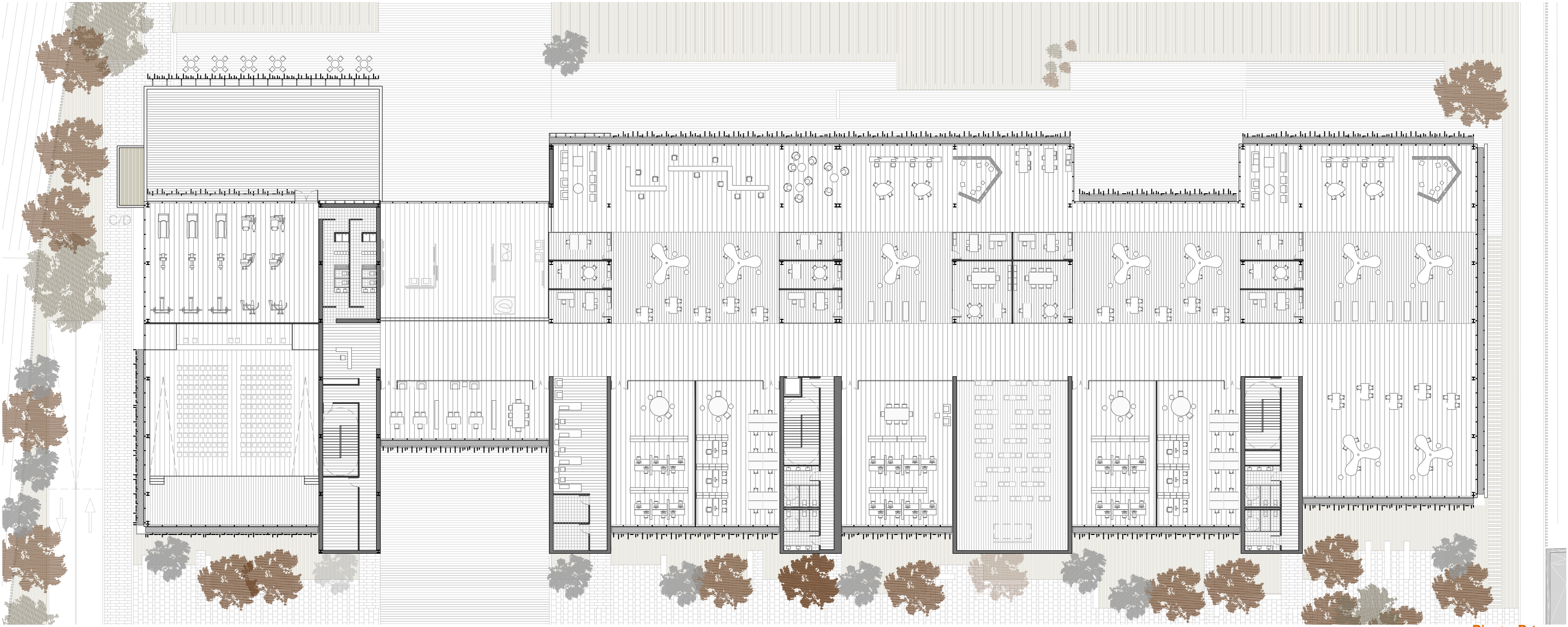
Planta Primera Escala 1:400