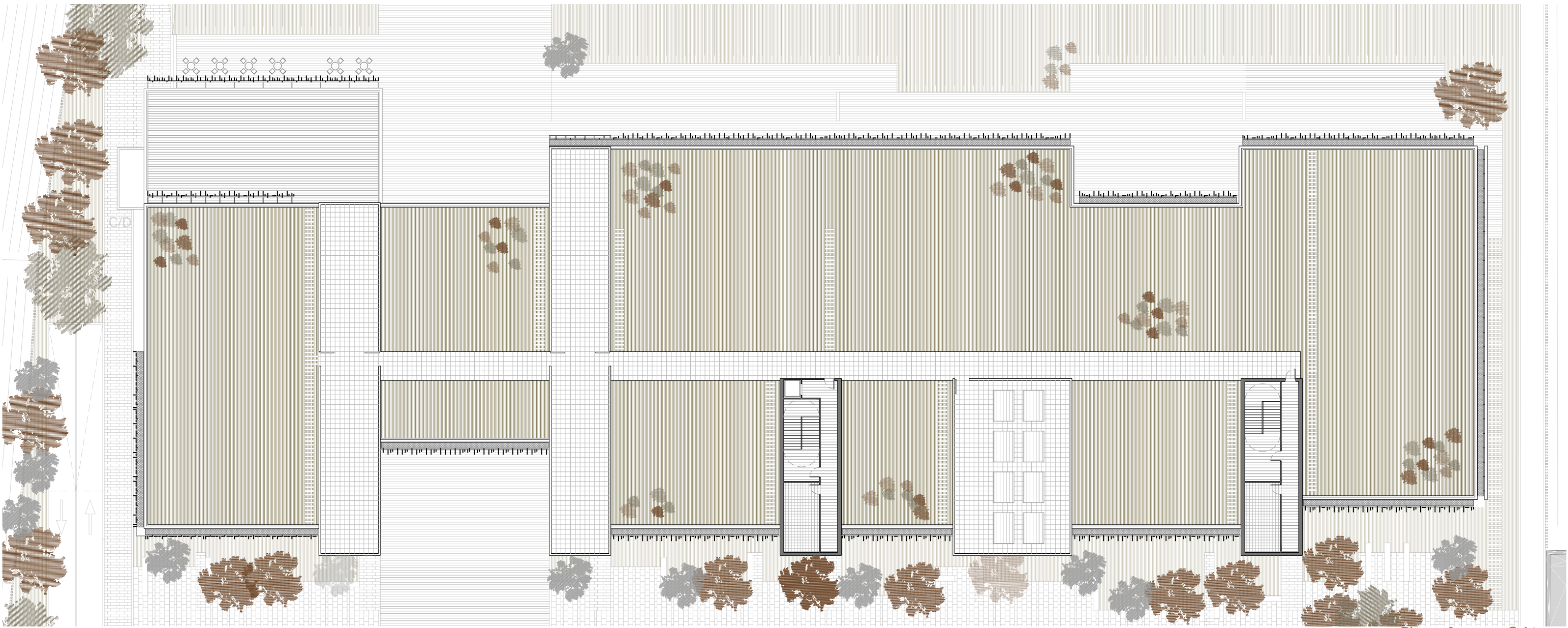
Planta Acceso a Cubiertas Escala 1:400