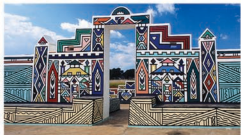
Geometría del arte nativo Ndebele como patrón a desarrollar Referente: Ndebele Cultural Village, Klipgat, North West, Pretoria