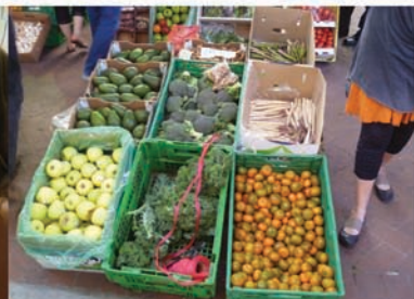
Productos frescos de venta al público Referente: Biscuit Mill Market, Johannesburg