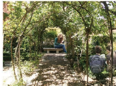
Áreas emparradas de lectura Referente: Jardines de Monforte, Valencia

Este tramo nace de la necesidad de un amplio espacio de conexión y/o espera vinculado a la estación central de Pretoria y, sobre todo, por la necesidad de un lugar de interacción y estudio que fomente un ambiente de intercambio intelectual entre los estudiantes de los colegios y las universidades más próximas. En la propuesta se incluye un edificio con función de cafetería y restaurante en la parte más próxima a la estación de tren, además de dos piezas de bibliocafé y una pequeña biblioteca en la zona norte. En el espacio abierto se desarrollan áreas emparradas para el estudio al aire libre, así como espacios de actividades para niños y adultos.