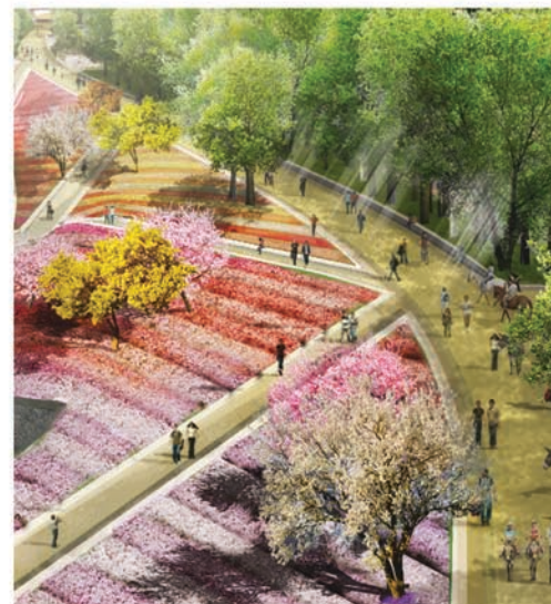
Recorrido de la geometría visual alternando entre gamíneas nativas Referente: Tapiz de Sant Andreu, Parc del Camí Comtal, Barcelona