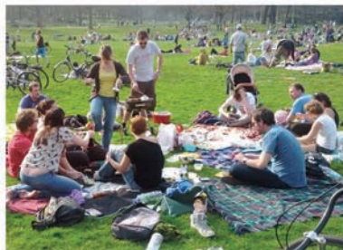
Zona acondicionada para las habituales "braat" Referente: Barbacoas en Volkspark Friedrichshain