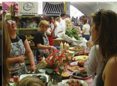
Degustación de cocina tradicional por regiones Referente: Biscuit Mill Market, Johannesburg