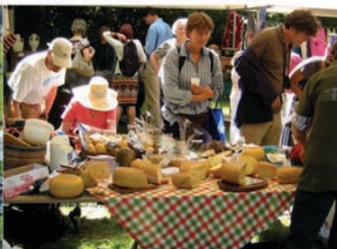
Mercadillo de productos varios Referente: Boer Markt, Moreleta Park, Pretoria