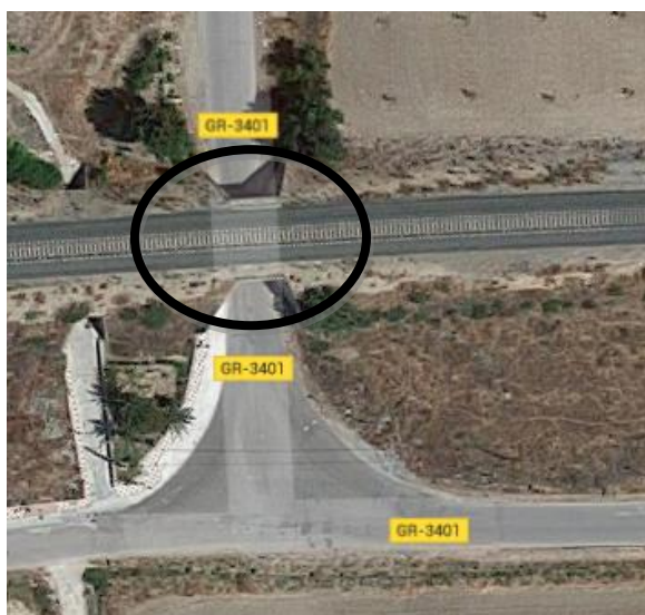
Imagen 5. Paso Inferior. Íllora