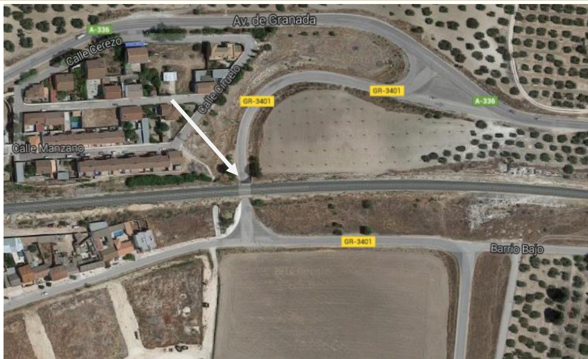
Imagen 4. Paso Inferior. Íllora