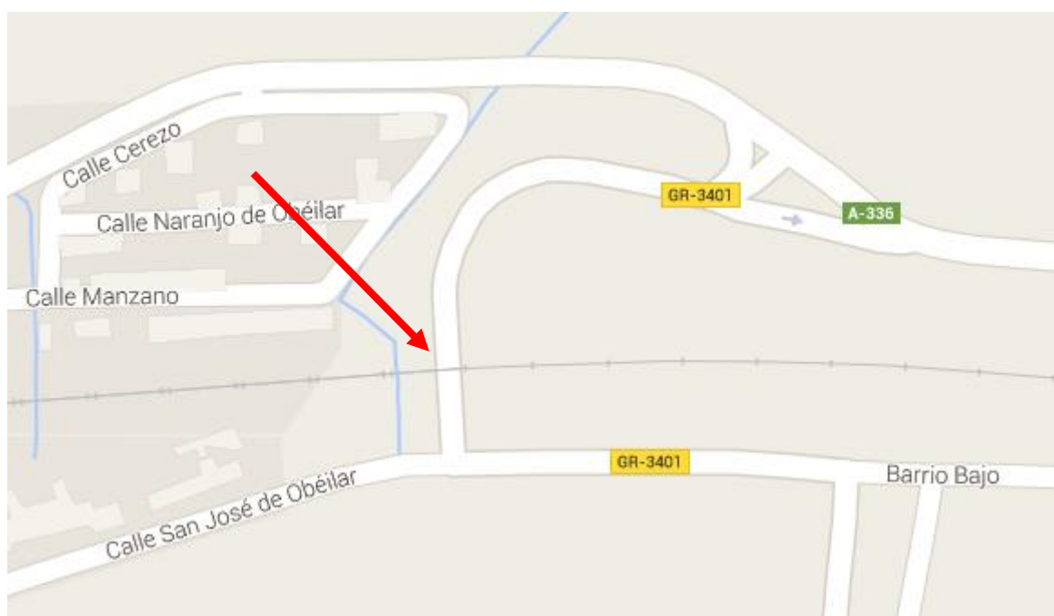
Imagen 3. Paso Inferior. Illora