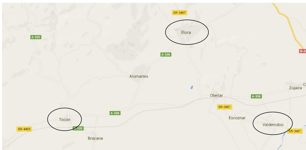
Imagen 1. Municipios de Granada: Íllora y Valderrubio. Pedanía Íllora: Tocón.

El presente proyecto se encuentra en la comunidad autónoma de Andalucía, más precisamente en el municipio de Íllora, provincia de Granada, en el tramo de Alta Velocidad entre Tocón, localidad y pedanía de Íllora y Valderrubio, municipio de Granada.