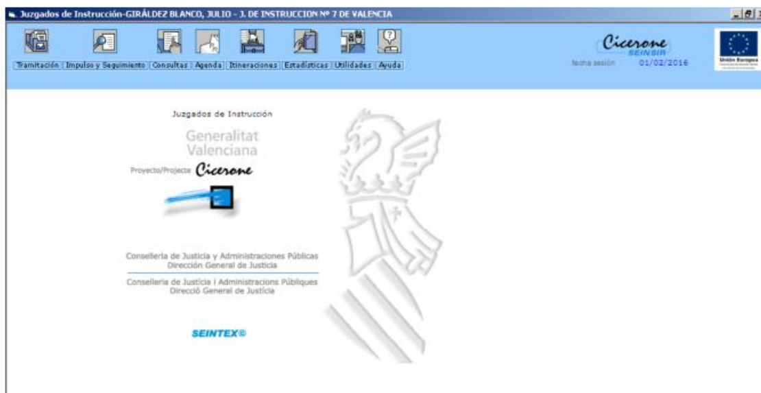
Ilustración 6. Sistema Cicerone

Actualmente en torno a 6000 usuarios lo usan a diario como su principal herramienta de trabajo y se encuentra instalado en 481 juzgados y tribunales de la Comunidad Valenciana.