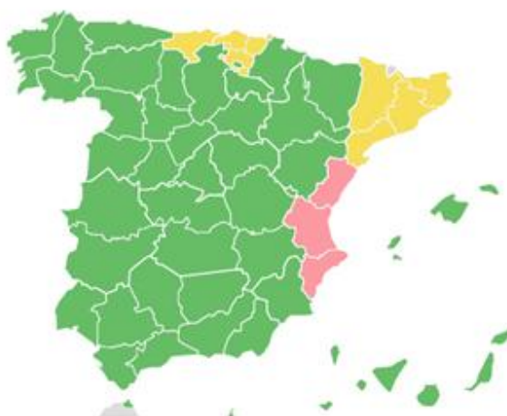
Ilustración 7. Mapa de Comunicaciones LexNET