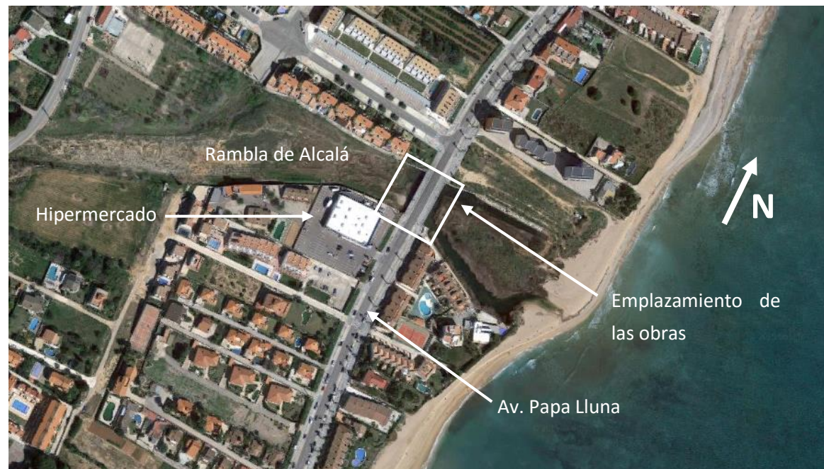
Figura 3 Emplazamiento de la actuación

Más concretamente, las obras se emplazan al sur del núcleo urbano, en la Avenida Papa Lluna a su paso sobre la zona de desembocadura de la Rambla de Alcalá.