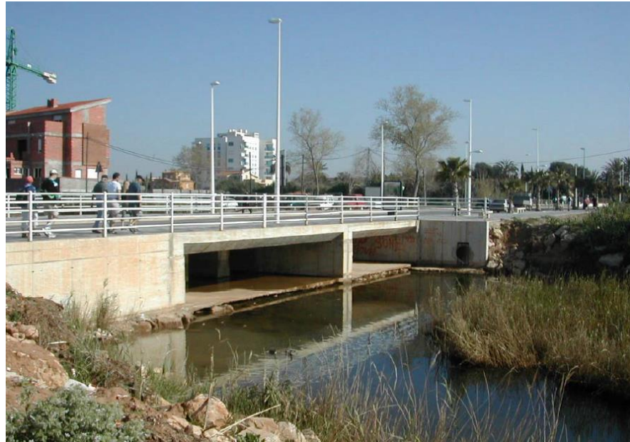
Figura 4 Estado previo de la zona de actuación

Se trataba de una obra de drenaje transversal consistente en dos marcos de hormigón armado que permitía el flujo de agua bajo la Av. Papa Lluna. Puede advertirse como la sección hidráulica de paso era significativamente reducida en comparación con la dimensión transversal del cauce de la rambla, de manera que la solución constituía una barrera al flujo en este punto de la desembocadura. Este hecho se manifestó claramente en las intensas lluvias acontecidas a principios del año 2003, cuando se inundaron las inmediaciones de este punto causando diversos daños materiales a los vecinos de la zona.