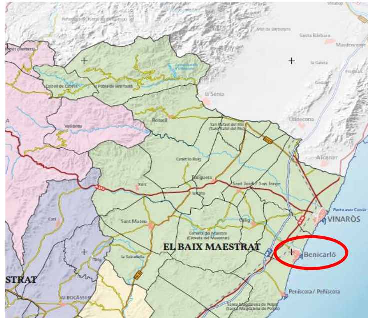
Figura 2 Localización geográfica de las obras

Más concretamente, las obras se emplazan al sur del núcleo urbano, en la Avenida Papa Lluna a su paso sobre la zona de desembocadura de la Rambla de Alcalá.