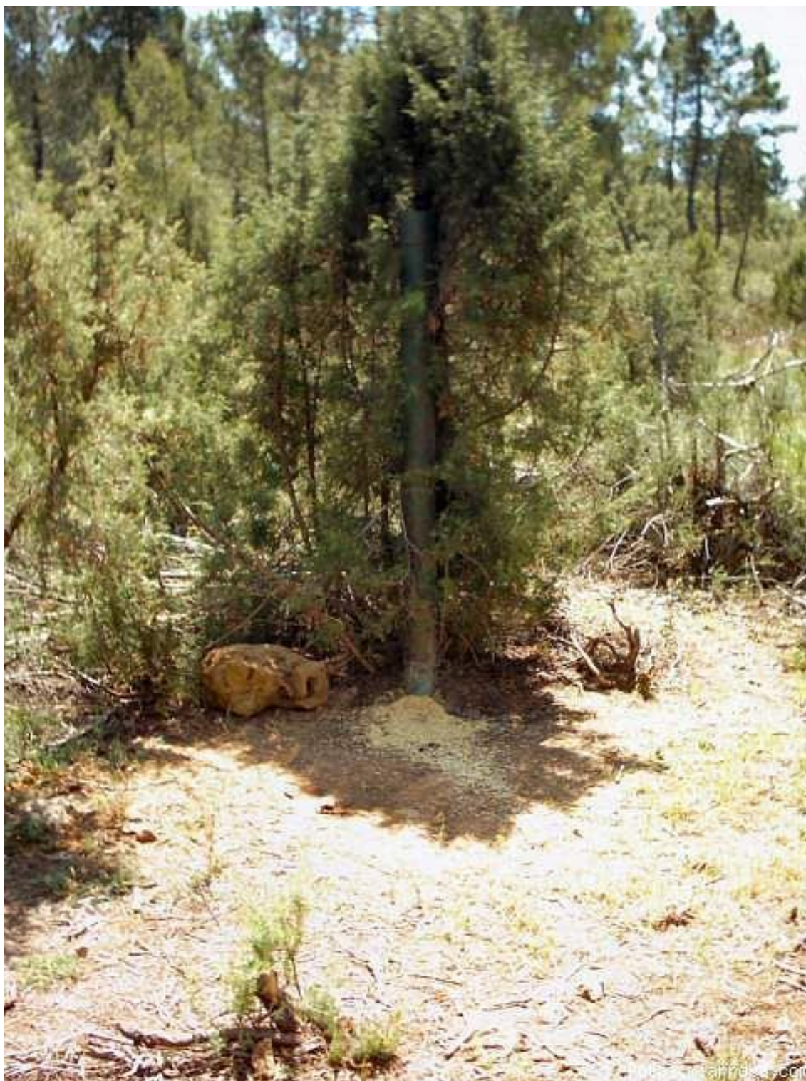
Figura nº11. Rayones comiendo en un comedero de tubo.