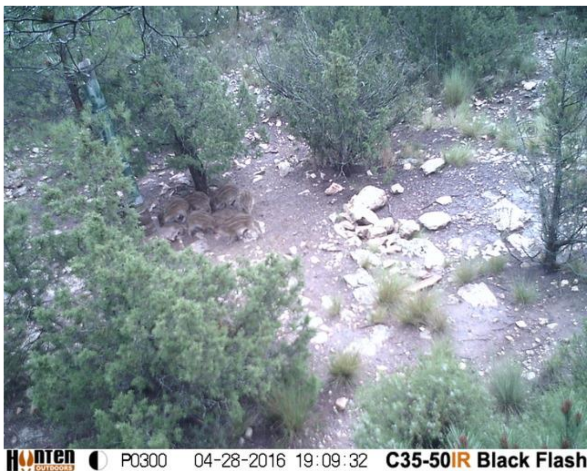
Figura nº12. Canal Júcar-Turia.