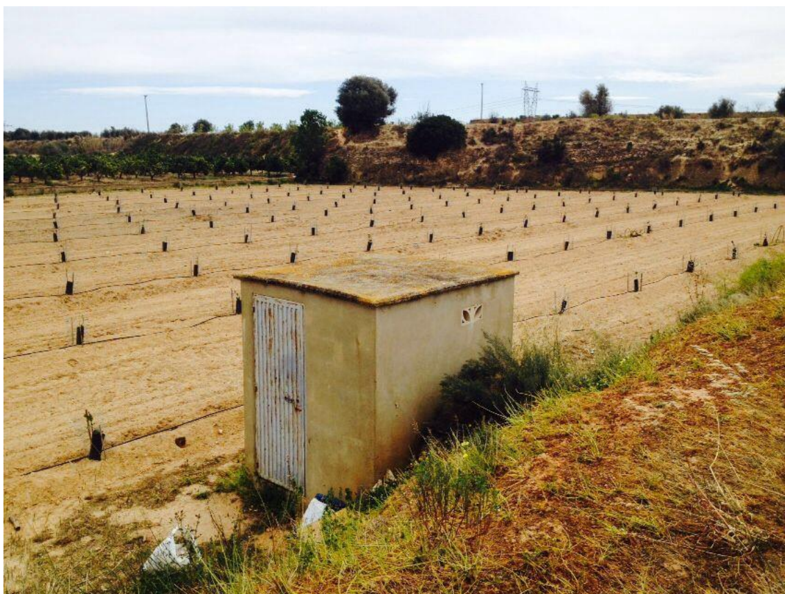
Figura nº7. Parcela de desbroce y roza.