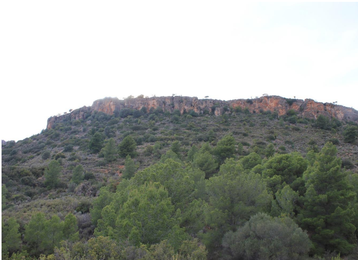
Figura nº1. Vista del paraje "La Soroixa".