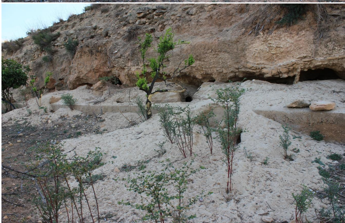
Figura nº6. Campo con protectores en la plantación de cítricos para evitar daños del conejo.