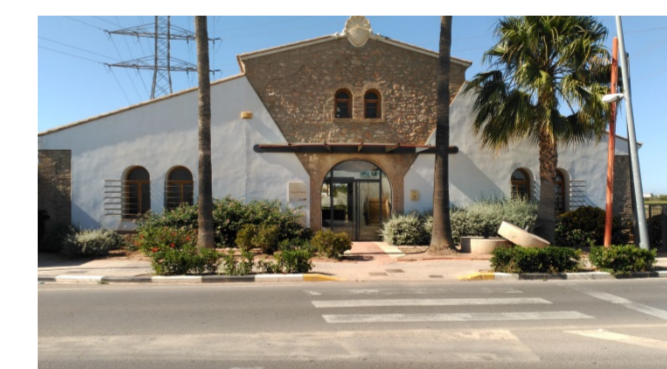
Figura 8. Museo de la huerta en el matadero de Almàssera

El matadero de Godella fue rehabilitado con el fin de ser un casal joven y un centro cultural.