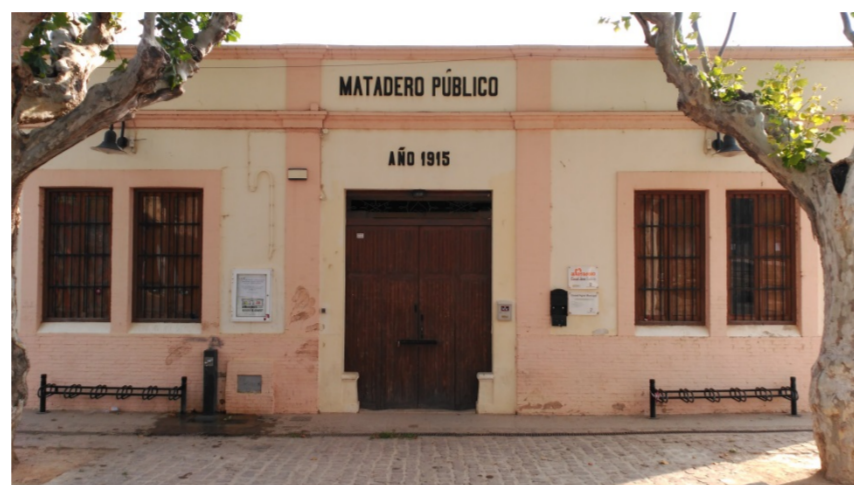
Figura 1. Imagen de la fachada del matadero público de Godella

Históricamente los mataderos han estado situados a las afueras de las poblaciones, lo más cerca posible de los lugares de producción. Sin embargo, y debido a la expansión demográfica, algunos se quedaron demasiado cerca del casco urbano y tuvieron que ser trasladados a las afueras nuevamente.