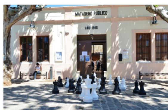
Figura 6. Casal Joven en el matadero de Godella

El complejo de la Petxina es un lugar deportivo y cultural situado en el antiguo matadero de Valencia.