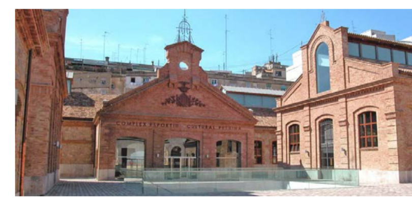
Figura 7. Complejo deportivo cultural Petxina en el matadero de Valencia

Matadero Madrid es un espacio de creación y difusión de cultura.