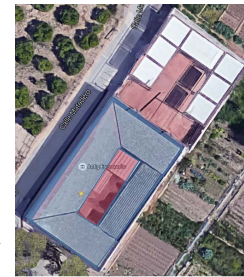
Figura 2. Vista aérea del matadero de Godella donde vemos en rojo el patio central y en azul las estancias que lo rodean.

Cabe destacar que todos los pequeños mataderos municipales analizados tienen una estructura similar. Todos tienen un espacio libre central a modo de patio, el cual está rodeado de las distintas naves o locales necesarios para el funcionamiento del mismo.