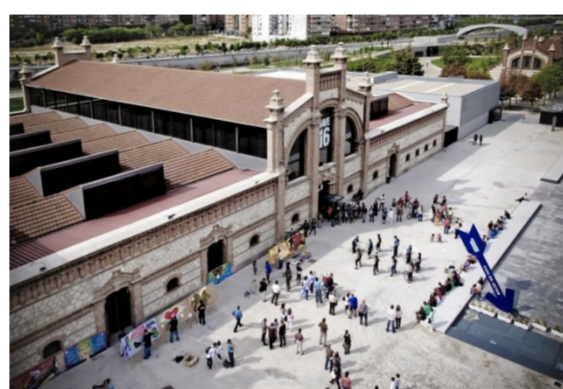
Figura 5. Espacio de creación y difusión cultural en el matadero de Madrid

Matadero Madrid es un espacio de creación y difusión de cultura.