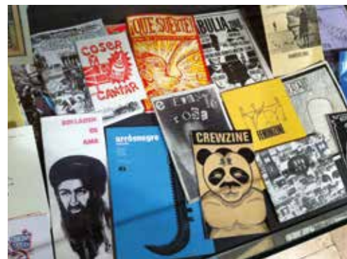
De arriba a abajo: Vista de Tenderete 2 / Silvia Poch Gutter Fest / Elías Taño. Inclsificables Salamanca