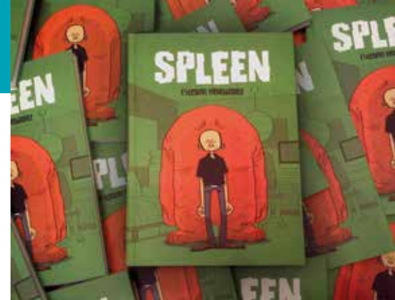
Esteban Hernández. Fanzine Spleen

pando desde 2011 en este y en otros eventos similares al escoger el camino de feriantes y titiriteros, con la maleta a cuestras llena de pesado papel. Un viaje que a veces he hecho solo y, otras muchas, rodeado de amigxs que hacen más ameno el camino. Pues con el tiempo (y con suerte) vas encontrándote con otrxs auto-editores y descubres otros zines . Pero, sobre todo, nos descubren a nosotrxs más personas cada día, más desconocidos se acercan, más (y menos) modernos se arriman y “ahí es no más donde compran buen oro”. Bueno, igual suena demasiado romántico. Todo esto lo explicaba con más tino y sin faltas de ortografía Martín López en la Nación de la gráfica Nómada 2 .