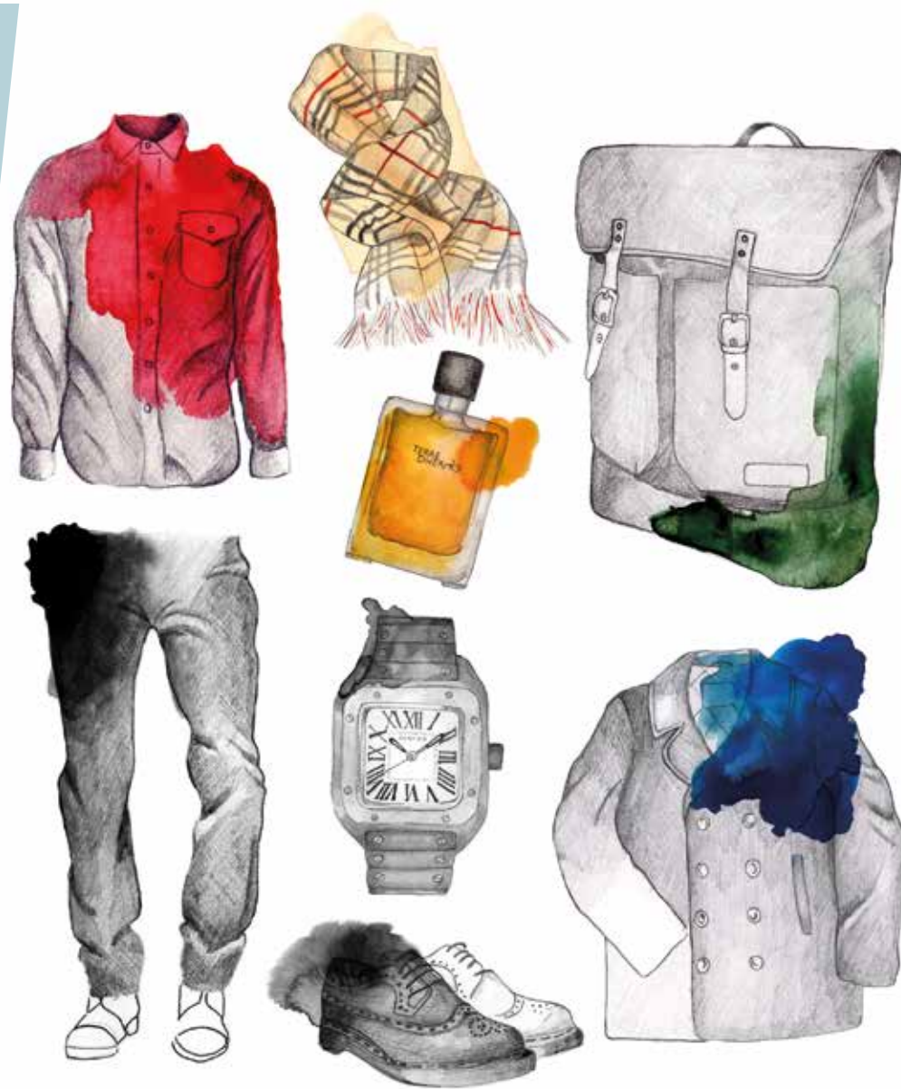
Ilustración para la revista Vanidad (sept.)