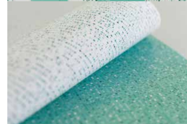
2Ar : Naming e Identidad para Armunia Arquitectos ( 2Ar ), el branding aporta información sobre la cercana relación con el cliente que el estudio ofrece. Pattern realizado a partir del logotipo inicial. Utilizando variaciones se consigue un efecto muy interesante