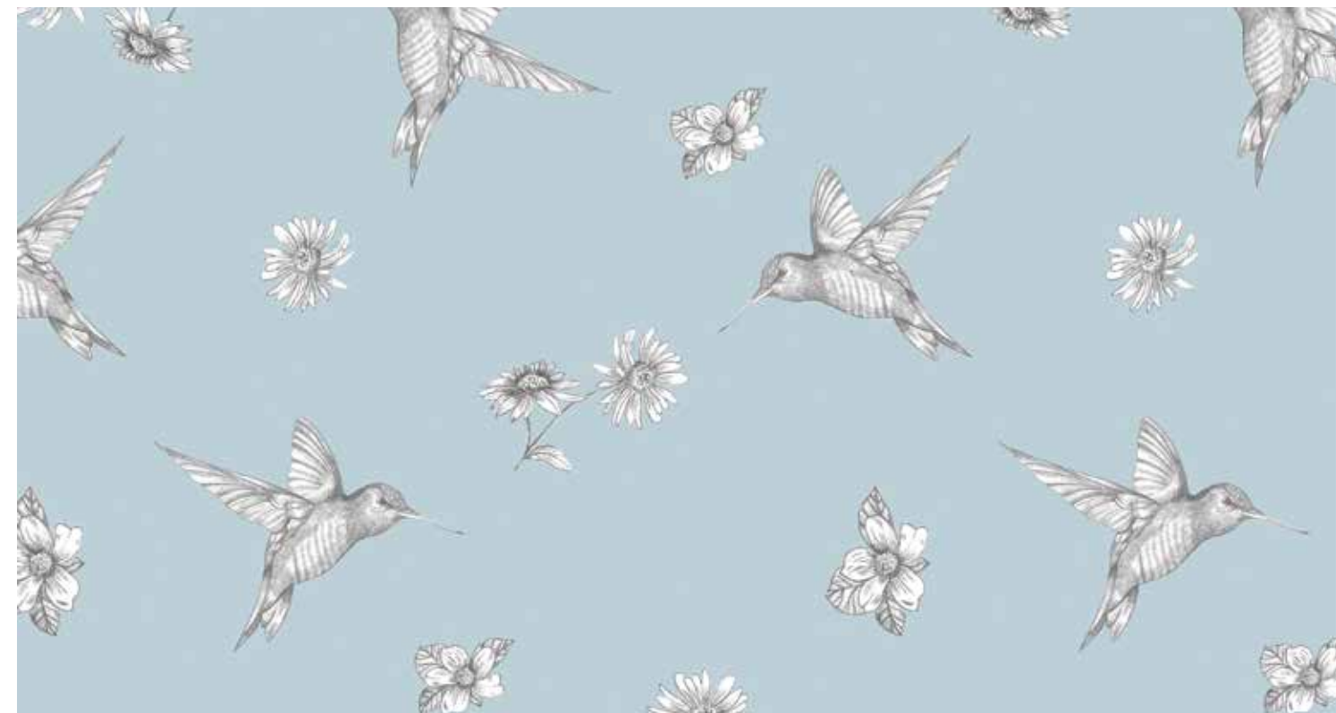
Pattern para Oysho

Uno de mis juegos favoritos cuando era pequeña era dibujar con mi hermana. Imaginábamos que viajábamos, inventábamos lugares inexistentes. Todo era posible con un simple papel y un lápiz.