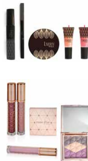
Productos Liverty para Deliplus

Mis planes de presente y futuro próximos son seguir colaborando con la revista Vanidad en la que publico cada mes, un proyecto personal de álbum ilustrado y por supuesto, en nuevas colecciones para Deliplus y Oysho.