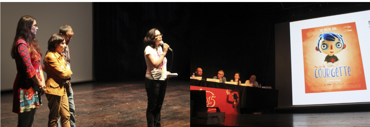
Fig. 4 – Presentación del largometraje Ma vie de Courgette en la sección “Work in Progress” de los Rencontres, de Anney.