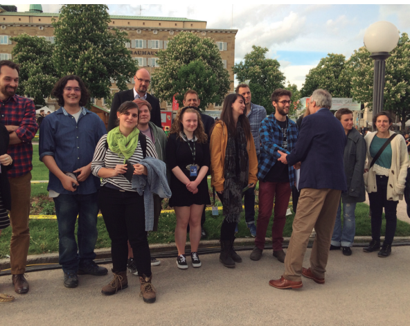
Fig. 2 – Entrega de premios Crazy Horse Session – 48 H Jam, en Stuttgart.

En esta edición, el país invitado, coincidiendo con la elección de Annecy, fue España. Para celebrar este evento, y en colaboración con el Festival de cine de Málaga, de la mano de Juan Antonio Vigar 1 se proyectaron dos programas de cortometrajes españoles realizados durante los últimos tres años, entre los que destacaron Cuerdas (Pedro Solís, 2013), El ladrón de caras (Jaime Maestro, 2013), Hotzanak, for your own safety (Izibene Oñederra, 2013), Astigmatismo (Nicolai Troshinsky, 2013), Canis (Marc Riba y Anna Solanas, 2013) o Vía Tango (Adriana Navarro, 2012). Además, se dedicó una retrospectiva a Segundo de Chomón (1871-1929), un gran desconocido para la mayoría del público, en un programa donde se pudieron ver quince cortometrajes realizados por el realizador aragonés entre 1905 y 1912.