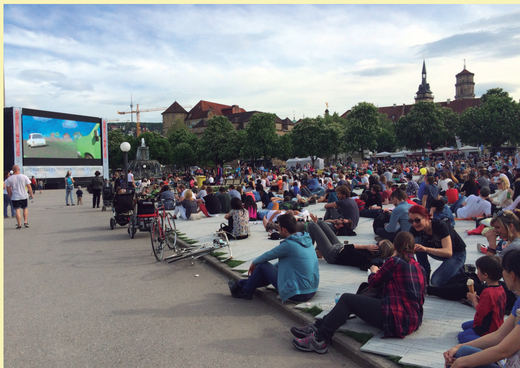
Fig. 1 – Proyección en la Schlossplatz de Stuttgart.