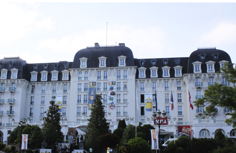
Fig. 5 – Sede del MIFA en el Hôtel L'Impérial de Annecy.