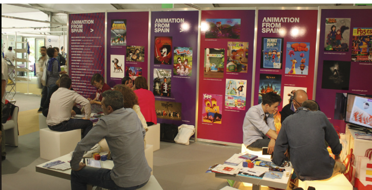
Fig. 7 – Stand de España en el MIFA, Animation from Spain.